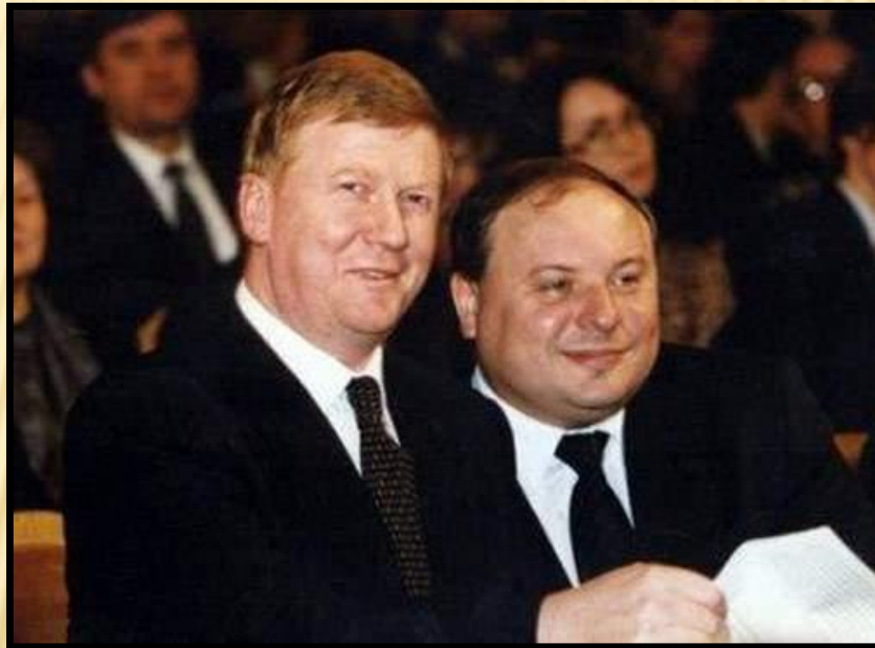
Инициаторы приватизации: Анатолий Чубайс и Егор Гайдар