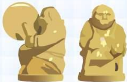
статуэтки из бивней моржа