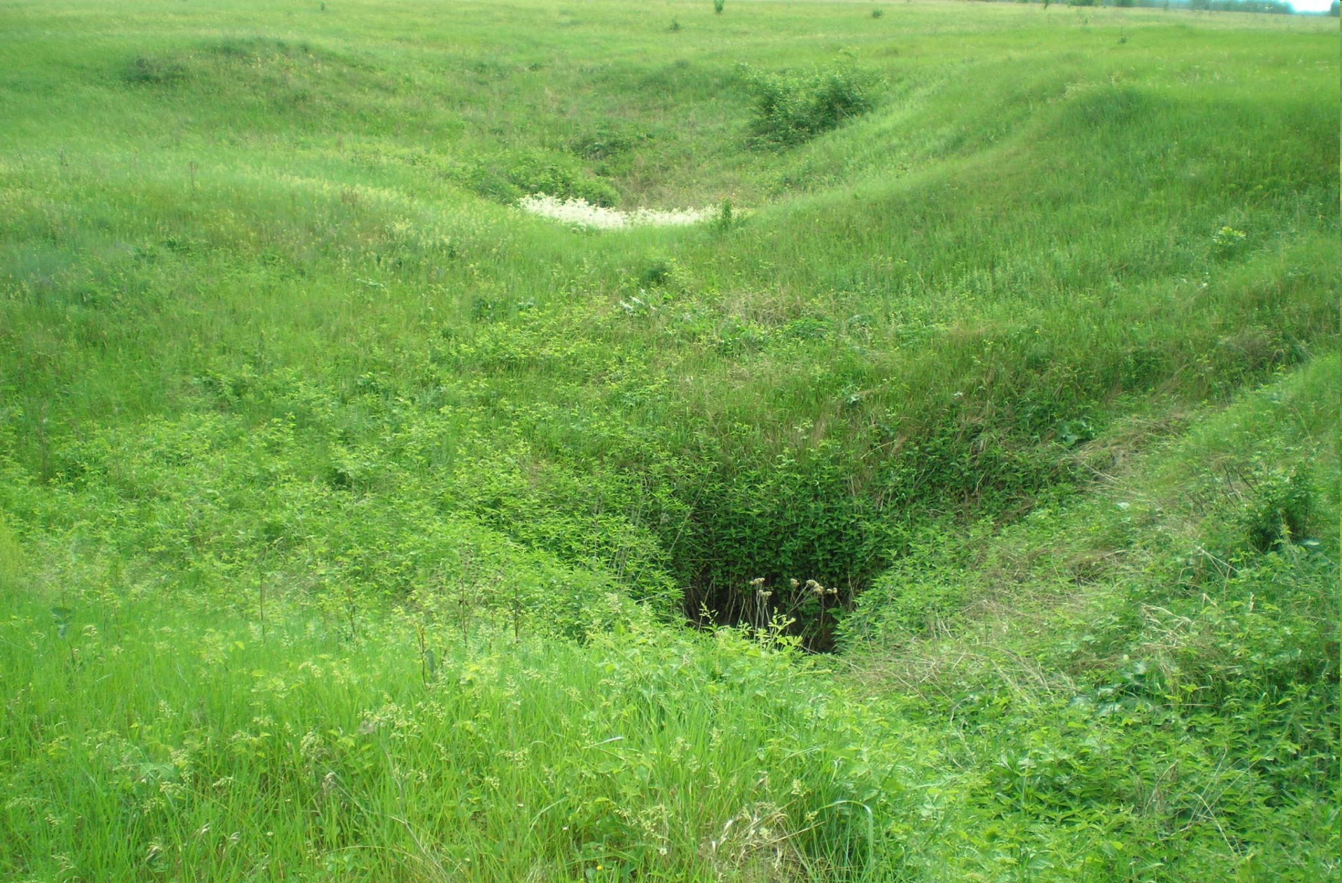
Урочище Морозова гора