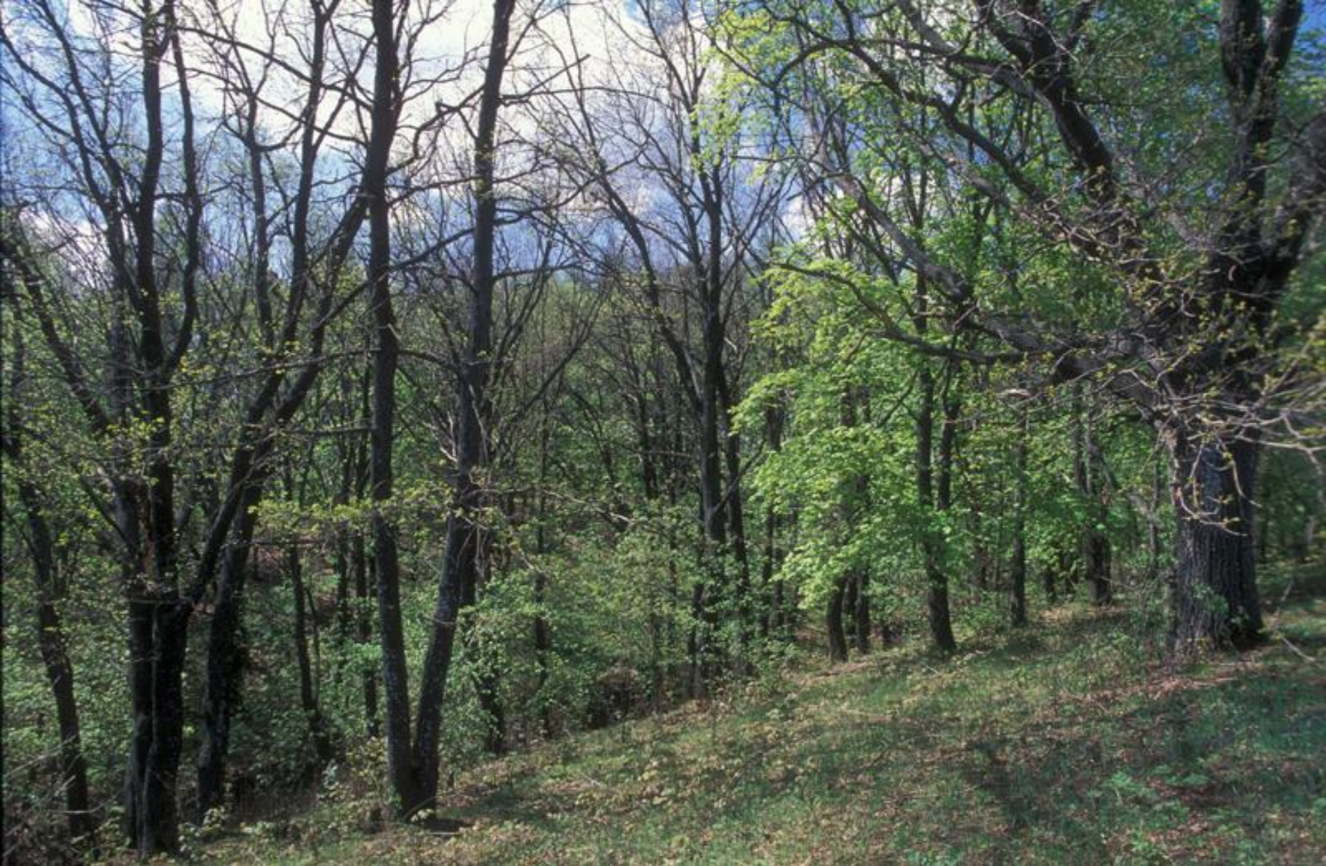
Урочище Галичья гора