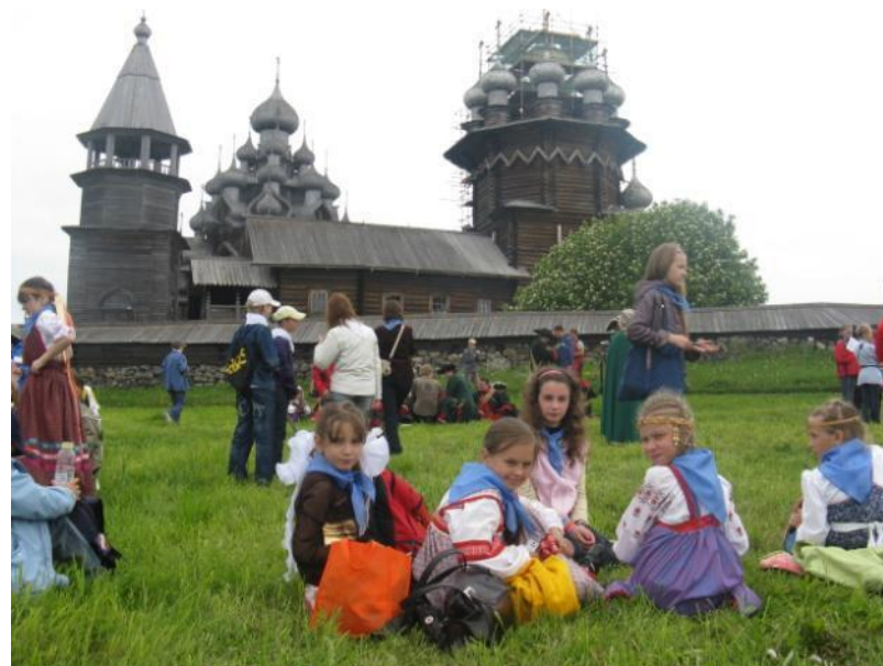
Кижский архитектурный ансамбль