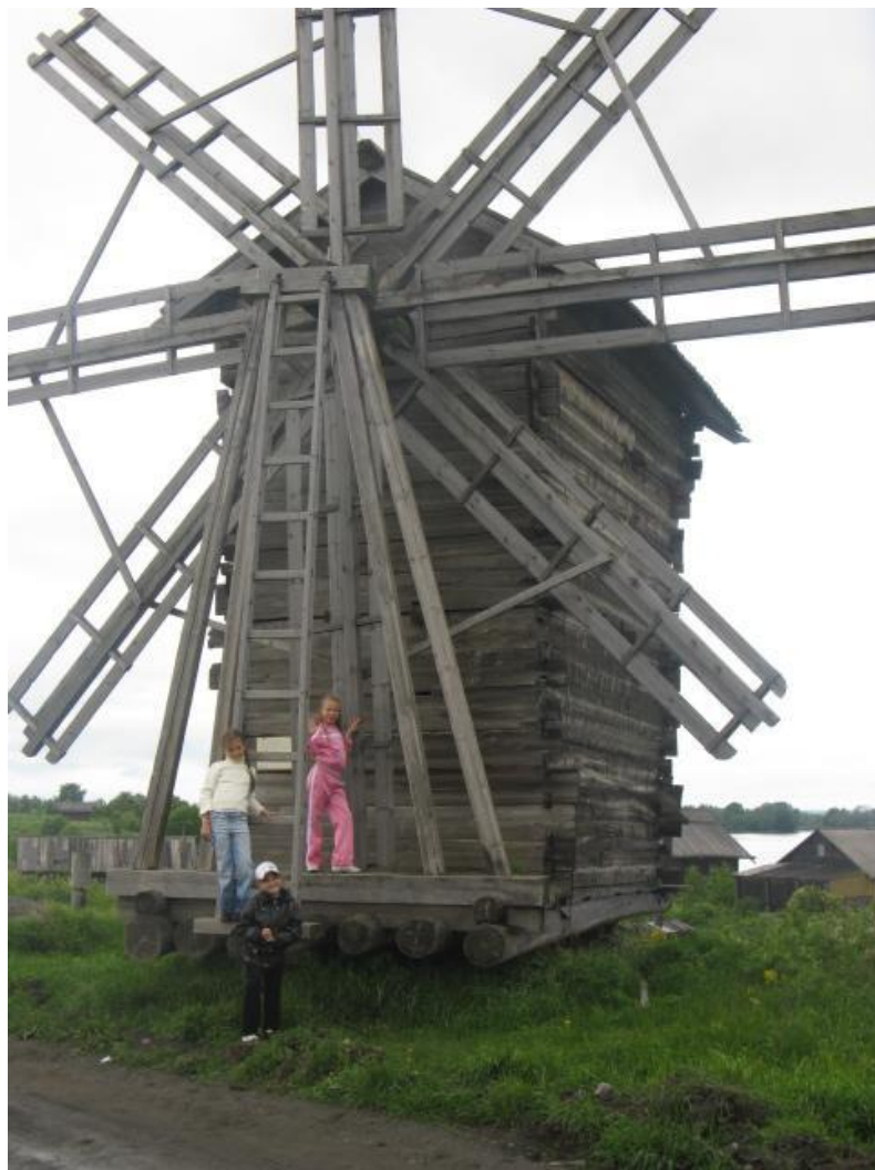
Ветряная мельница из д.Вороний Остров, 1921г.