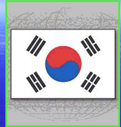
Флаг Республики Корея