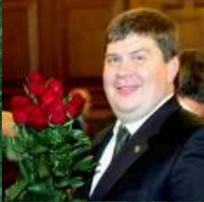
премьер-министр Айгарс Калвитис