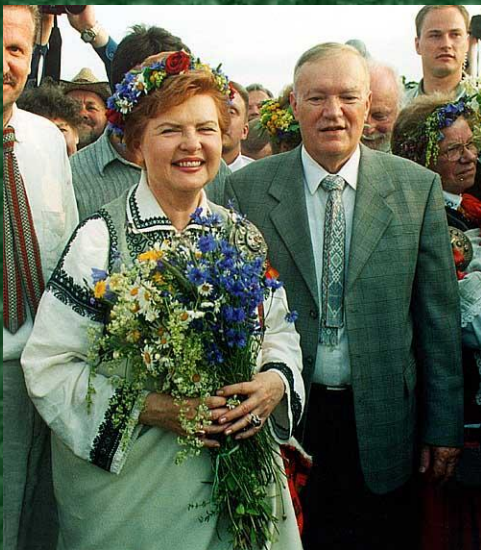
президент Латвии Вайра Вие-Фрейберга