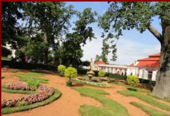
Монплеzir «Мое удовольствие»