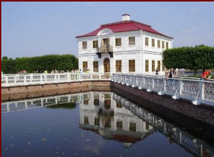
Дворец Марли Малые приморские палаты