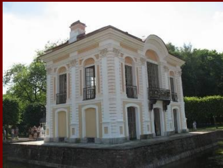
Павильон Эрмитаж «Приют отшельника», «Уединенный уголок»