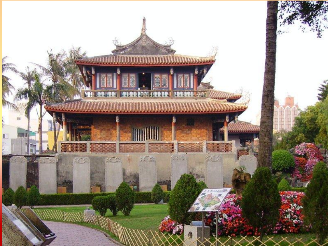
Тайнань. Храм Конфуция