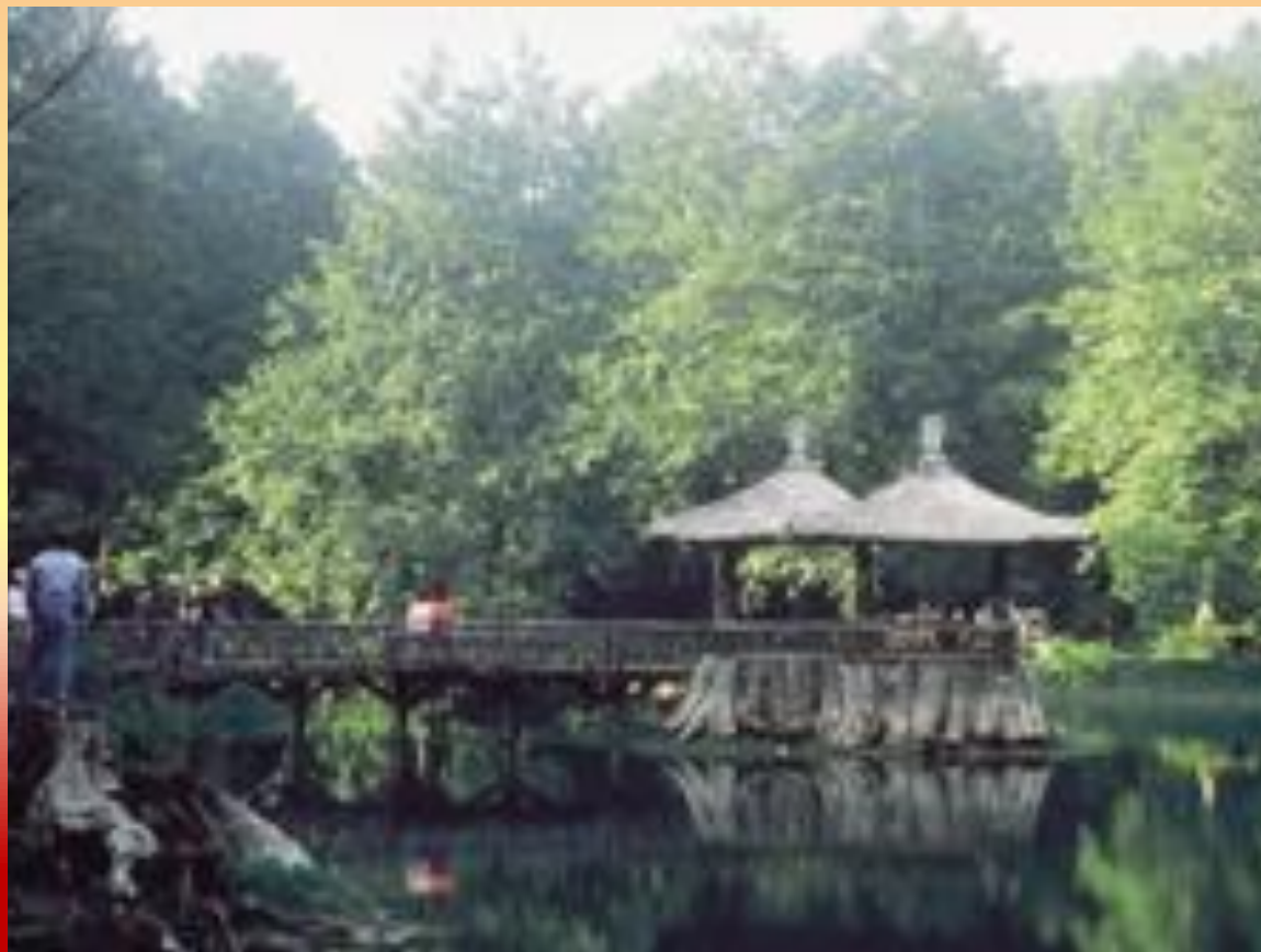
姊妹潭 - Пруд сестер