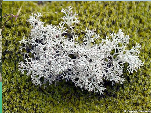
Олений лишайник (ягель)