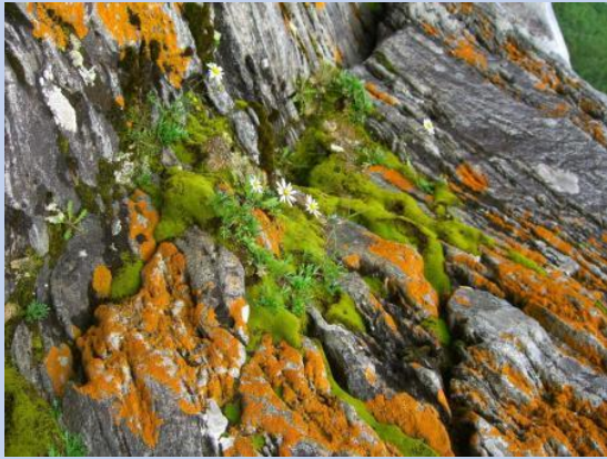
лишайники и мхи