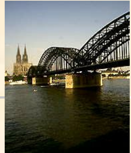
Мост через Рейн

Кельнский собор. Здание строилось в 1248-1560 гг., а в 1842-80 гг. было окончательно закончено. Завершение строительства стало символом национального возрождения Германии.