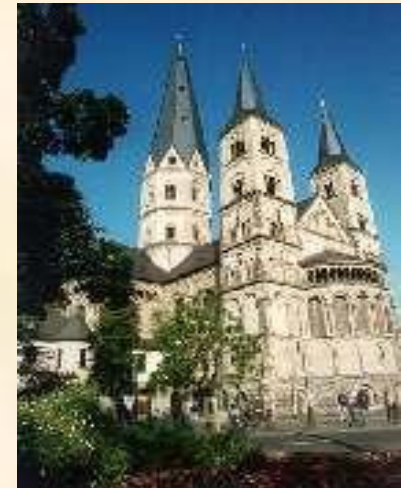
Кафедральный собор XI-XIII вв.