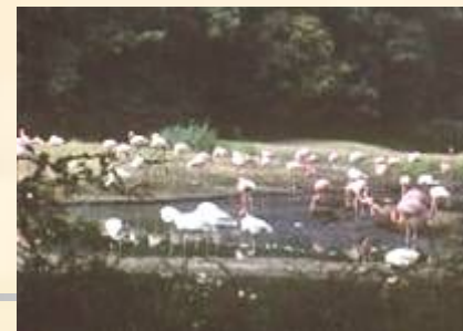
Фламинго в Берлинском зоопарке