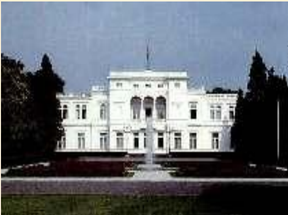
Резиденция федерального президента

В городе находится здание парламента – бундестага, резиденция главы правительства – дворец Шаумбург, административные здания виллы посольств.