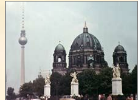
Берлинский собор. На заднем плане – Берлинская телебашня на Александрплац