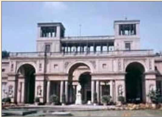
Дворец в Сан-Суси

Название Потсдам впервые упоминается в X в. С конца XVIII в. был второй резиденцией прусских королей. В Потсдаме проходила конференция глав правительств СССР, США и Великобритании — Потсдамская (Берлинская) конференция 1945 года (во дворце Цецилиенхоф).