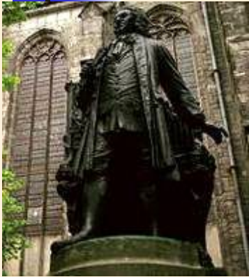
Памятник композитору И.С.Баху

Лейпциг - крупный промышленный и торговый центр Германии, здесь проводятся ежегодные международные ярмарки, пушные аукционы, расположен международный аэропорт.