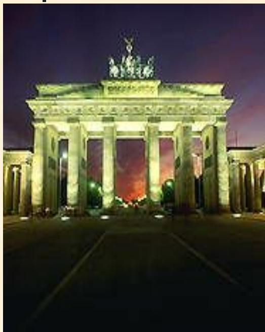
Бранденбургские ворота в историческом центре Берлина