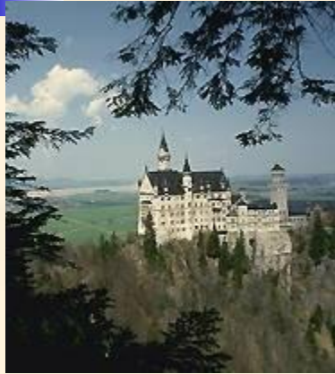
Старинный замок в Баварии