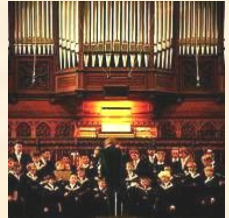
Хор в церкви Томаскирхе