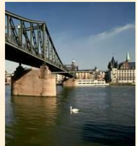
Мост через Майн