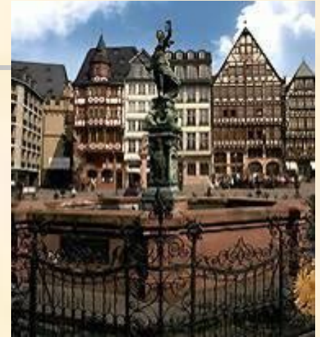
Исторический центр города

Франкфурт-на-Майне - крупный финансовый и торговый центр. Международный аэропорт «Рейн-Майн». Крупный университет и научно-исследовательские институты атомных исследований. Родина И. В. Гете. Известен с конца VIII в. Знаменит готическим собором XIII-XVI вв. и ратушей XV-XVIII в