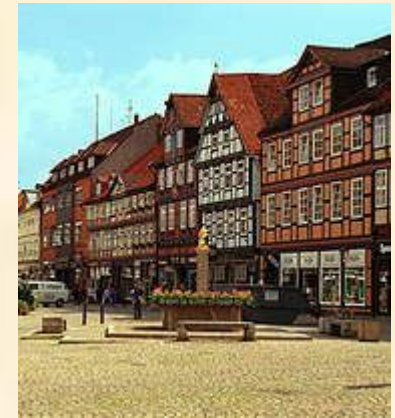
Старинные дома Эрфурта