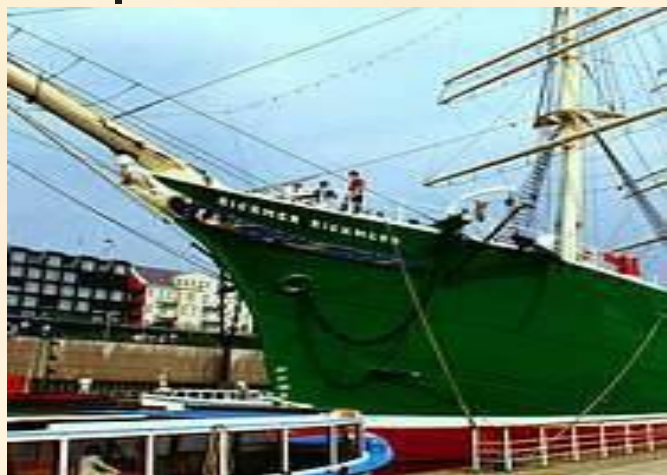
Гамбург. Корабль-музей «Риккар-Рикменс»

Север страны – это ее «морские ворота». На многие километры тянется германское побережье Северного и Балтийского морей.