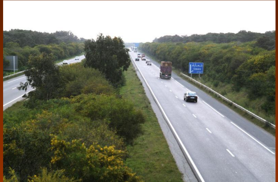
Автодорога А3 Касабланка — Рабат в Марокко