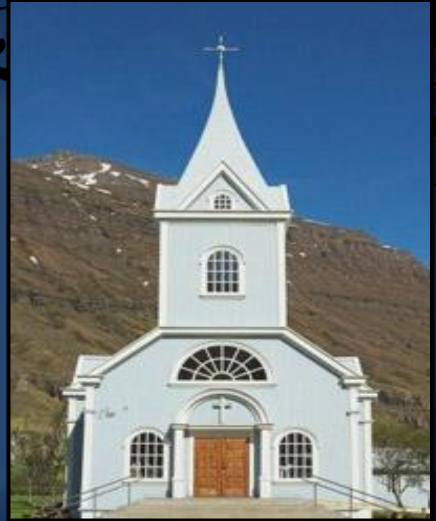
Лютеранская церковь в Норвегии

Религиозный состав населения: лютеране – 85,5%, пятидесятники – 1%, католики – 1%, другие христиане – 2,5%, мусульмане – 1,9%, прочие – 8,1%.