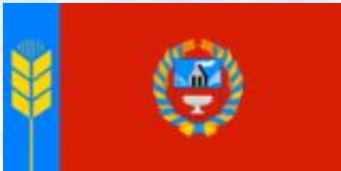
Флаг Республики Алтай