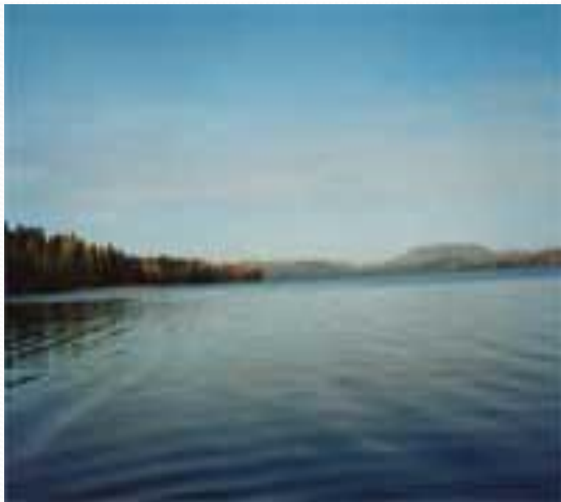
Памятник природы. ОЗЕРО ТИБЕРКУЛЬ