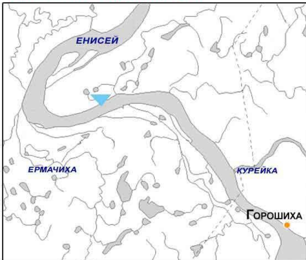
Памятник природы ЛЕДЯНАЯ ГОРА