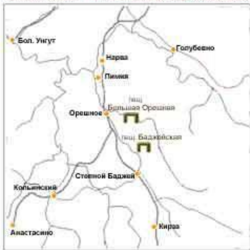
Памятник природы ПЕЩЕРЫ БОЛЬШАЯ ОРЕШНАЯ, БАДЖЕЙСКАЯ