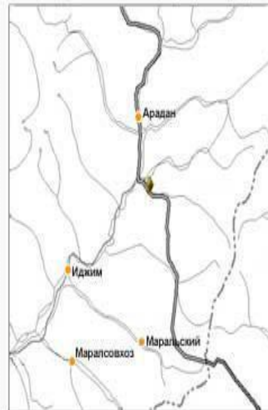
Памятник природы: Геологический разрез по р. Ореш