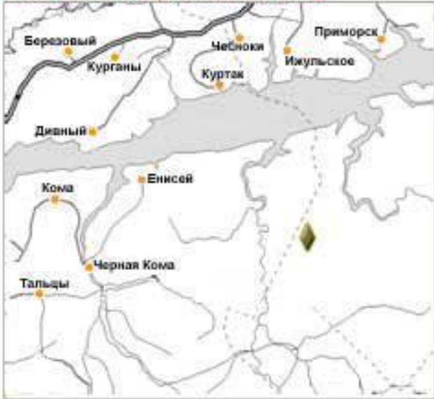
Место падения метеорита Палласово железо