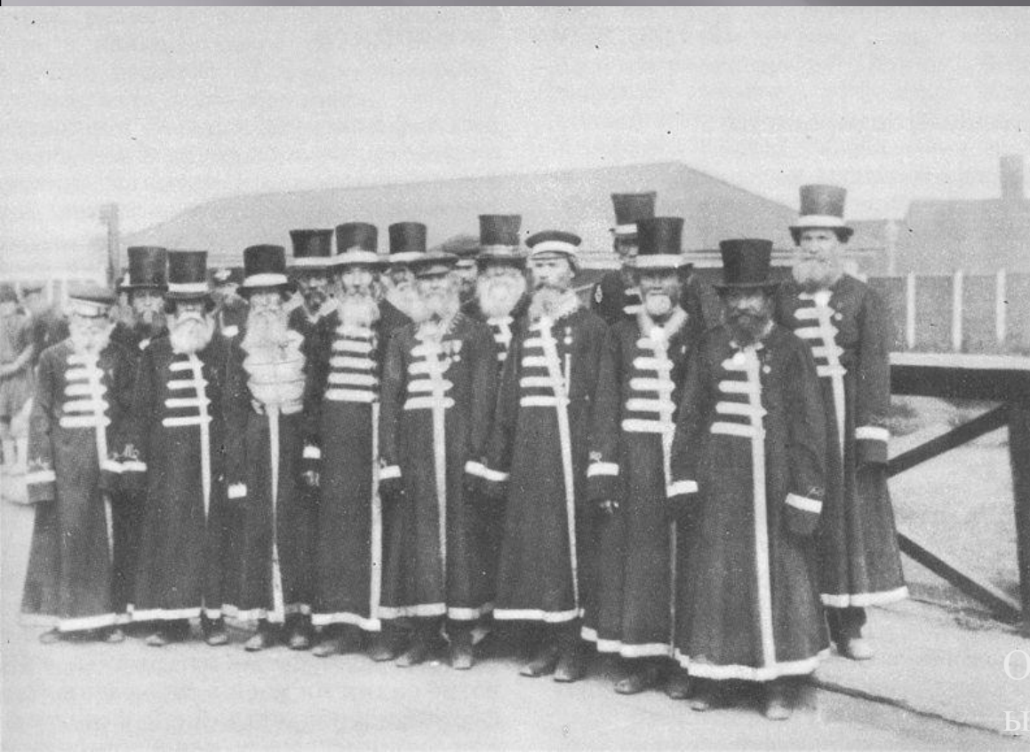
Оружейные мастера Ижевского завода в военные годы.