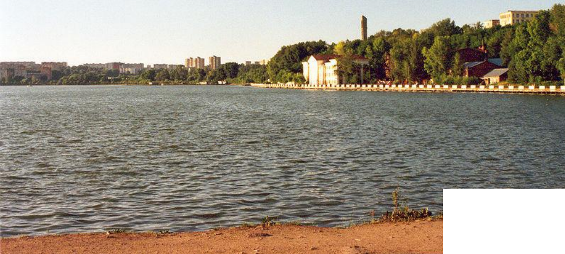
Резиденция президента Удмуртии