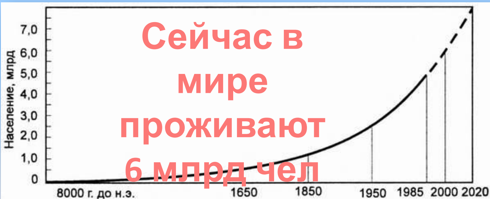
Рис. 10.1. Рост населения в мире