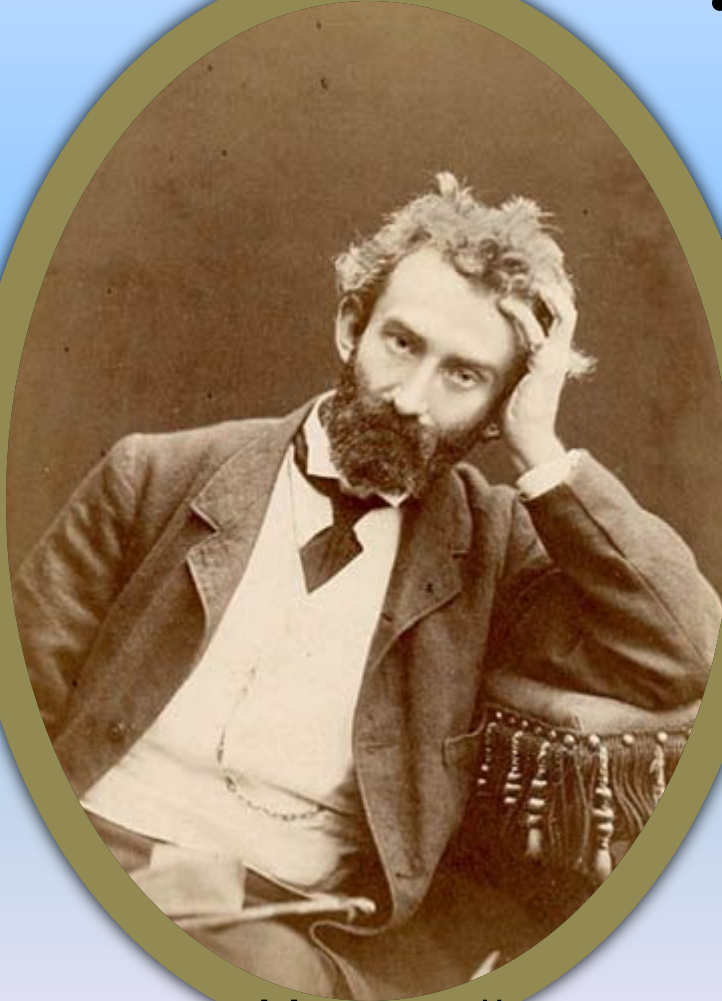
Николай Николаевич Миклухо-Маклай