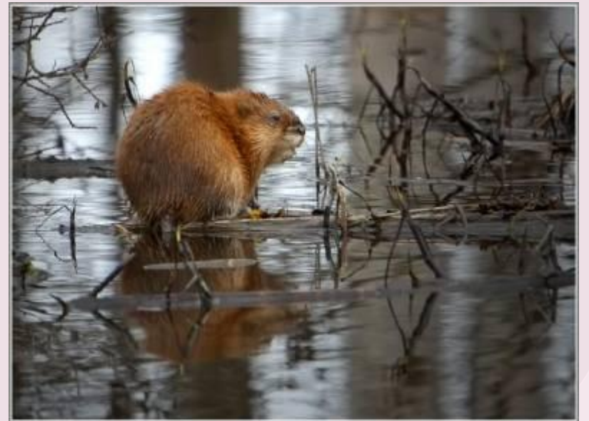
Бобр и ондатра