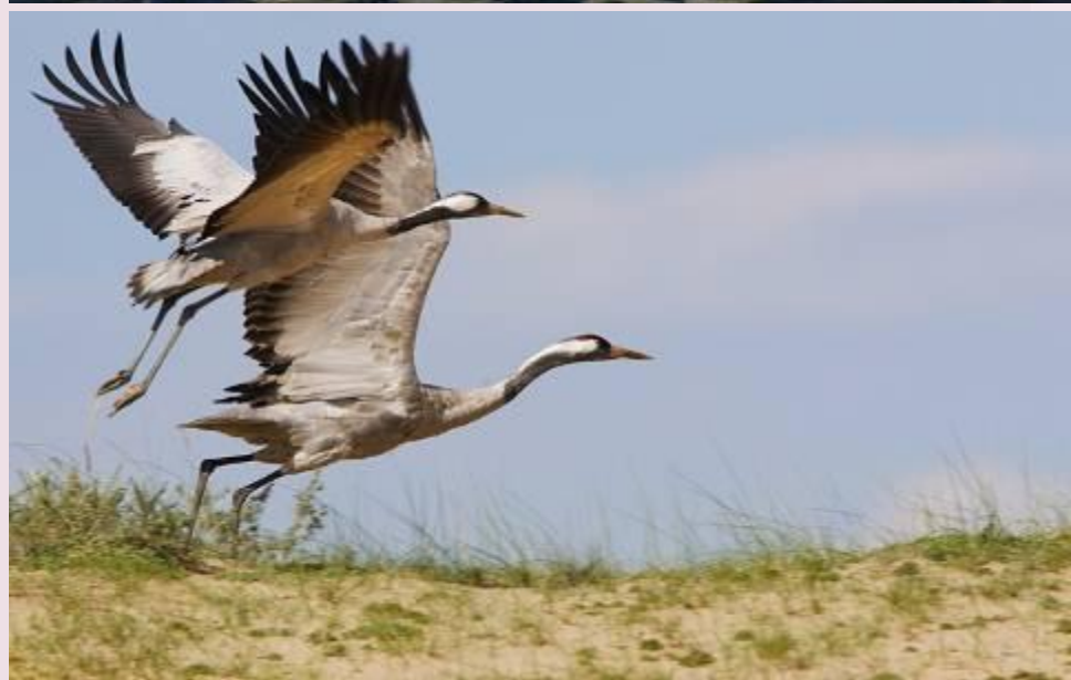
Лебедь- шипун и журавли