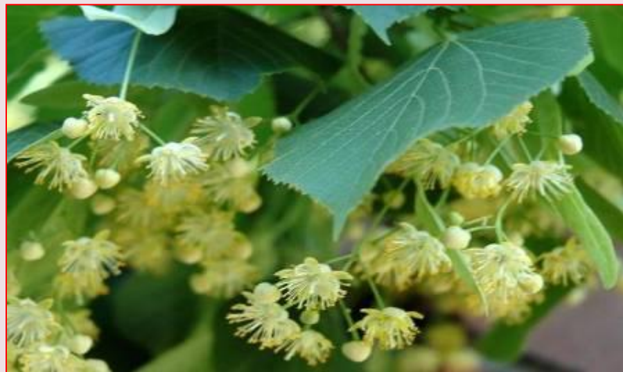
Ветки ясеня и липы