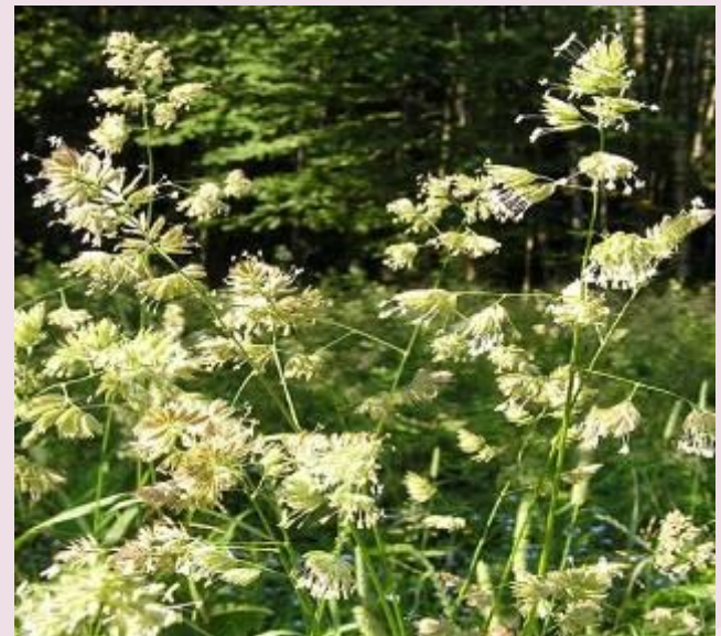
Полевица и ежа сборная