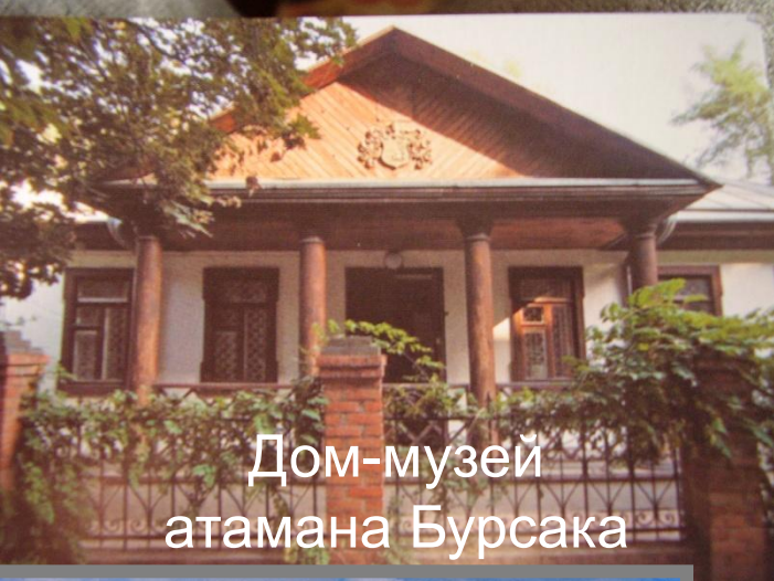
Дом-музей атамана Бурсака