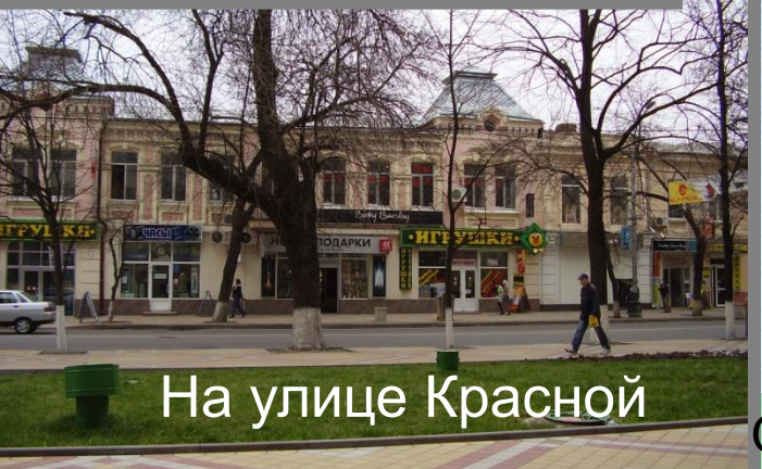
На улице Красной