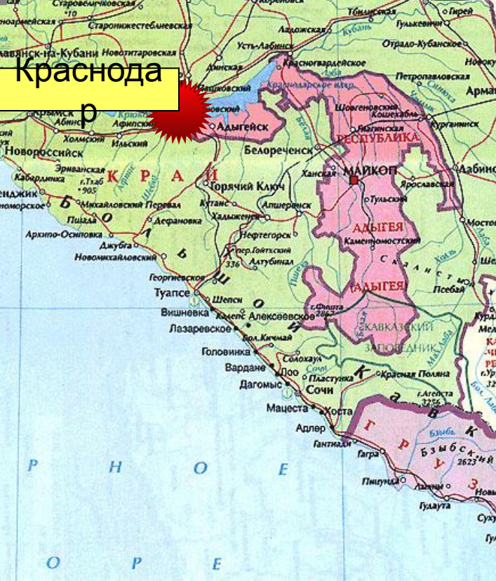
О.В.Ткачук (Туапсинский район)