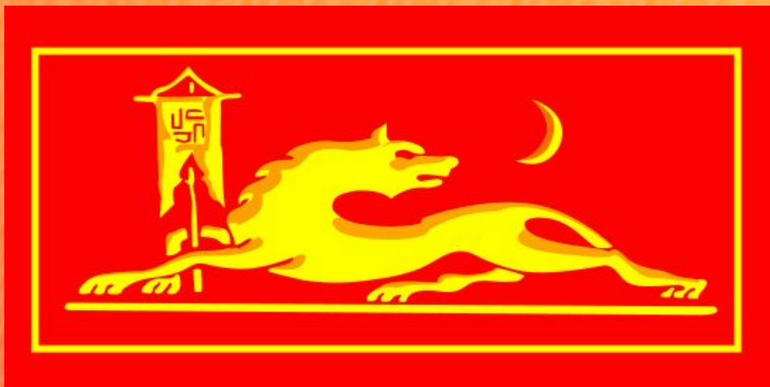
Герб аварских ханов (по грузинскому историку и путешественнику Вахушти Багратиони, XVIII век)