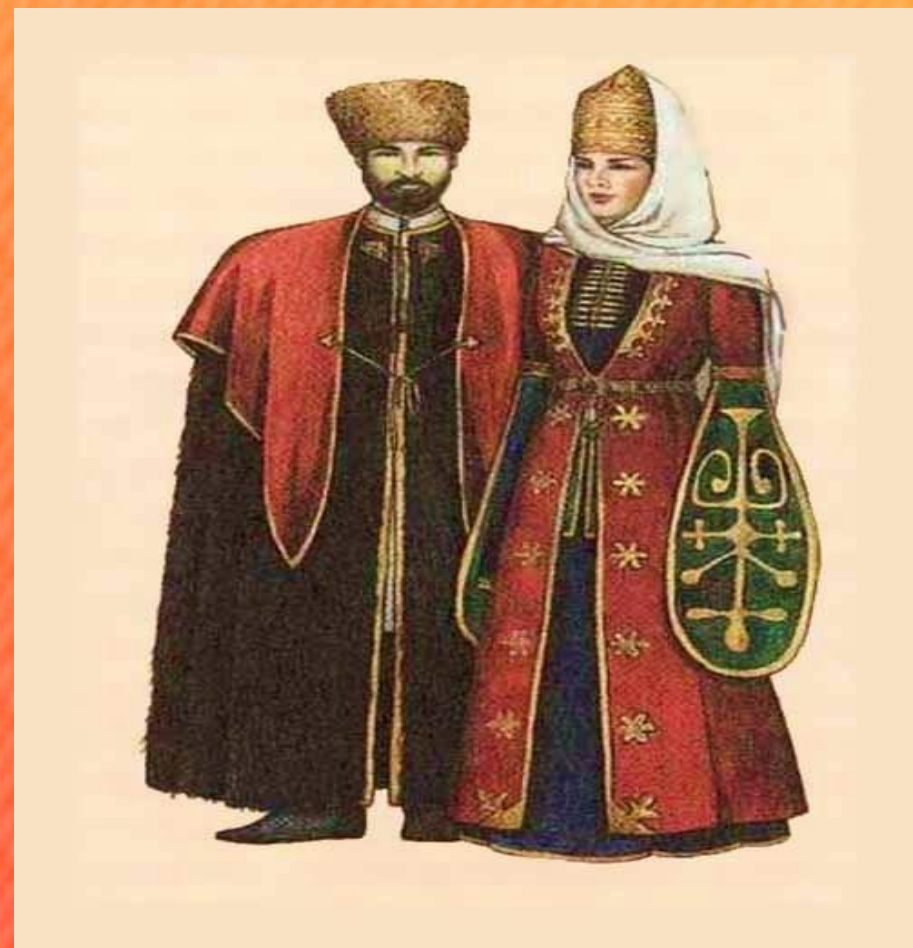
Народный костюм адыгов