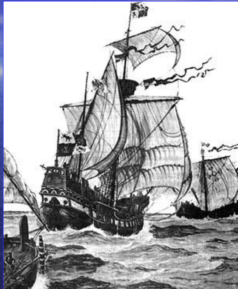
Корабли экспедиции Христофора

Росло число врагов Колумба среди дворян, недовольных тем, что он сурово карал участников экспедиции за непослушание. В 1500 г. Колумб был смещен со своего поста и в оковах отправлен в Испанию. Ему удалось восстановить свое доброе имя и совершить еще одно путешествие в Америку. Однако после возвращения из последнего путешествия он был лишен всех доходов и привилегий и умер в бедности.