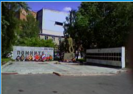
мемориал павшим в годы ВОВ