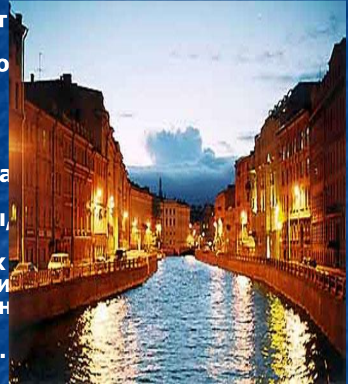
Санкт-Петербург, набережная реки Мойки