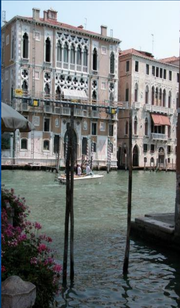
Венеция. Большой канал

Побывав в этом чудесном городе, мы поняли, что Санкт-Петербург называют «Северной Венецией» не только из-за внешнего сходства их архитектурных памятников и ансамблей, но и из-за удивительной схожести атмосферы, царящей в этих всемирно известных городах. Питер, как и Венеция, расположен на огромном количестве каналов. И как по каналам Венеции плавают гондолы, так по каналам Петербурга путешествуют прогулочные катера с туристами и отдыхающими горожанами.