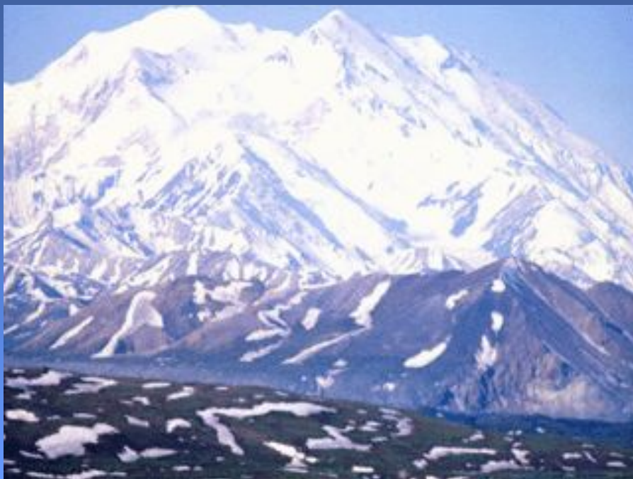
Гора Мак -Кинли