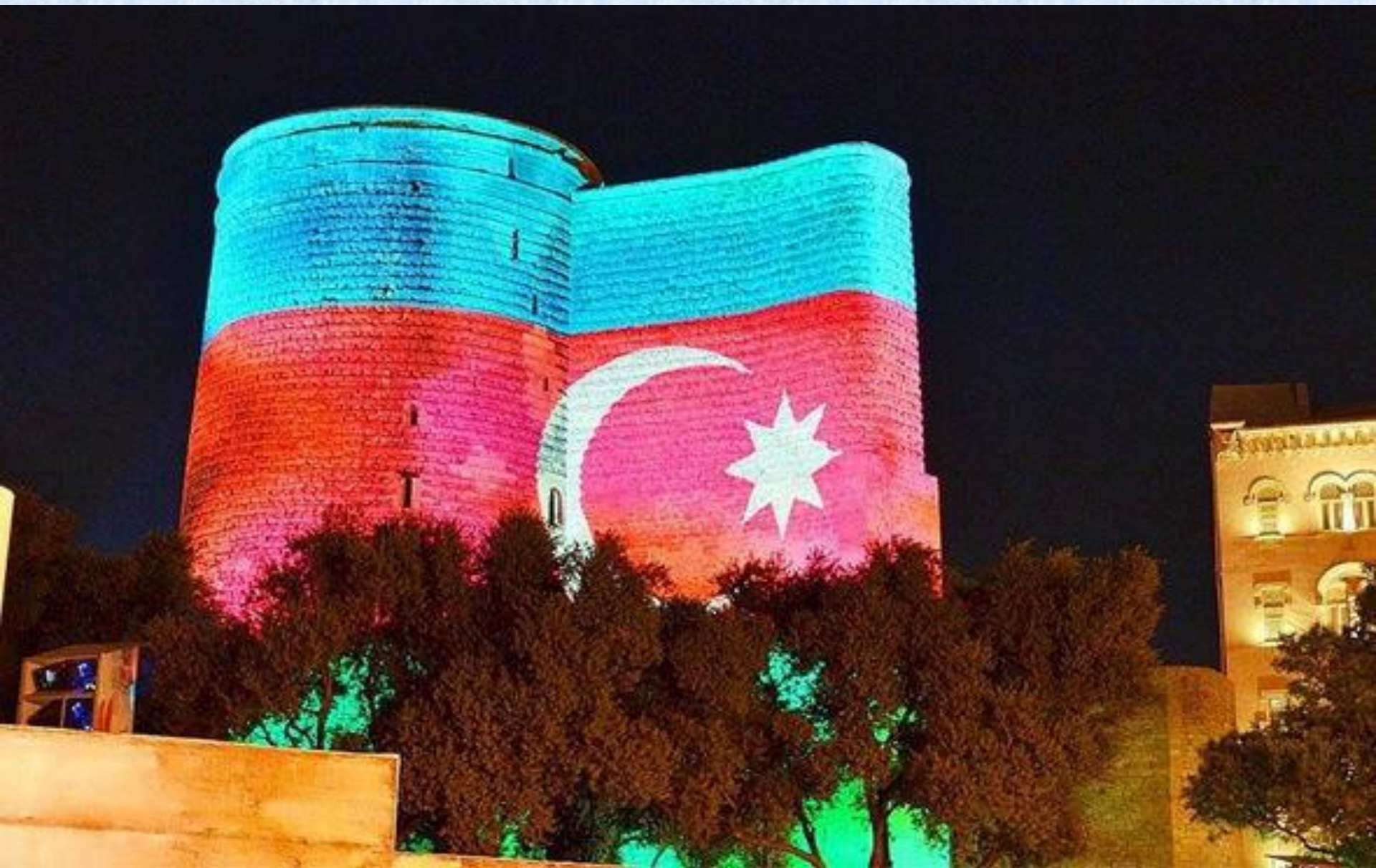
Giz Galasi (Девичья Башня) – символ Баку