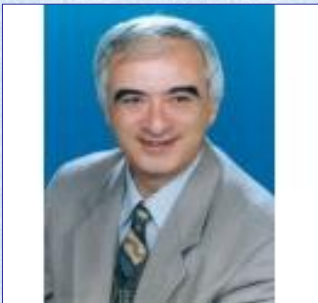
Полад Бюль- Бюль Оглы - певец