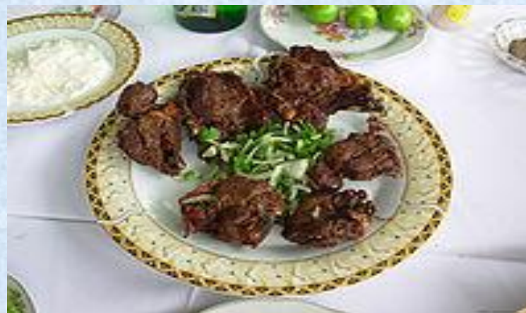
Кебаб из джейрана и даг-кечи