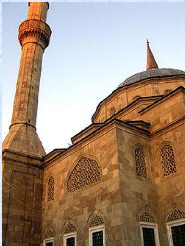
Мечеть в Баку

Ислам является основной религией в Азербайджане; около 99,2 % населения страны составляют мусульмане. Абсолютное большинство населения Азербайджана принадлежит к шиитской ветви ислама, меньшинство — к суннитской. Приблизительно 85 % населения Азербайджана являются мусульманами-шиитами и 15 % мусульман-суннитов.