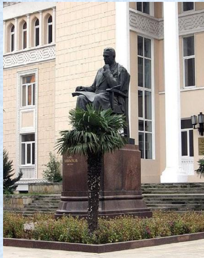
Памятник Узеиру Гаджибекову в Баку (композитор, музыковед, педагог, общественный деятель)

Он пел на семидесяти языках мира. Одинаково виртуозно исполнял эстрадные шлягеры и оперные арии. Не полмира - весь мир обошел Рашид Бейбутов. Он пел перед Пиночетом и Мао Цзедунгом, королем Эфиопии и шахом Ирана