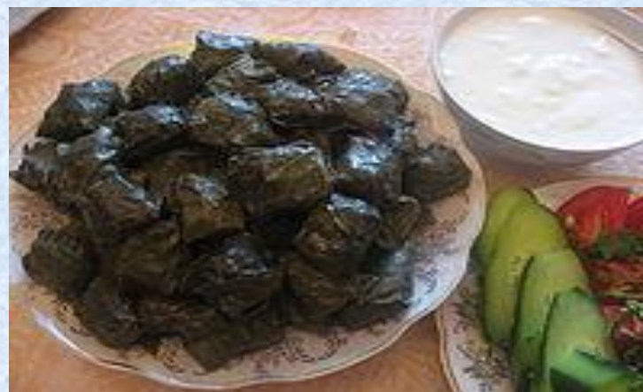
Долма из виноградных листьев