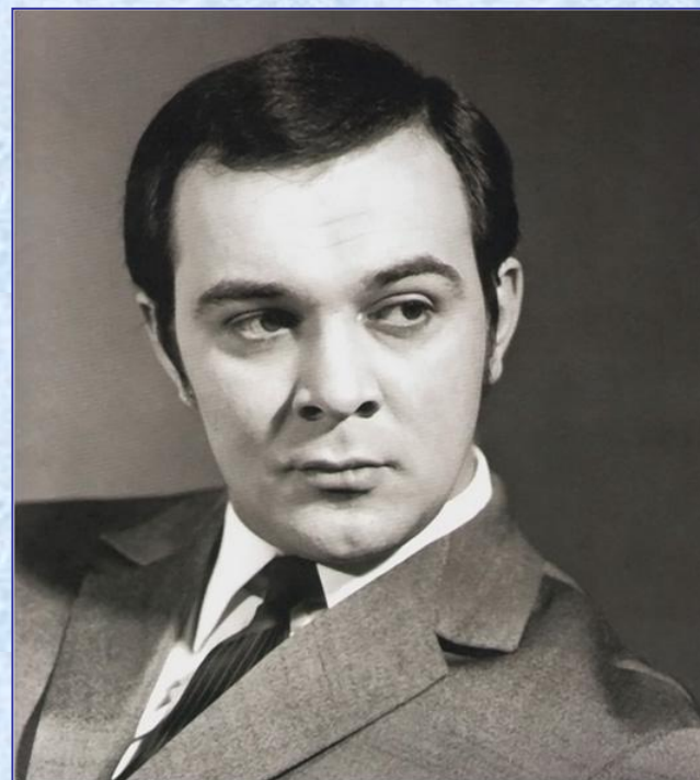
Муслим Магомаев - певец