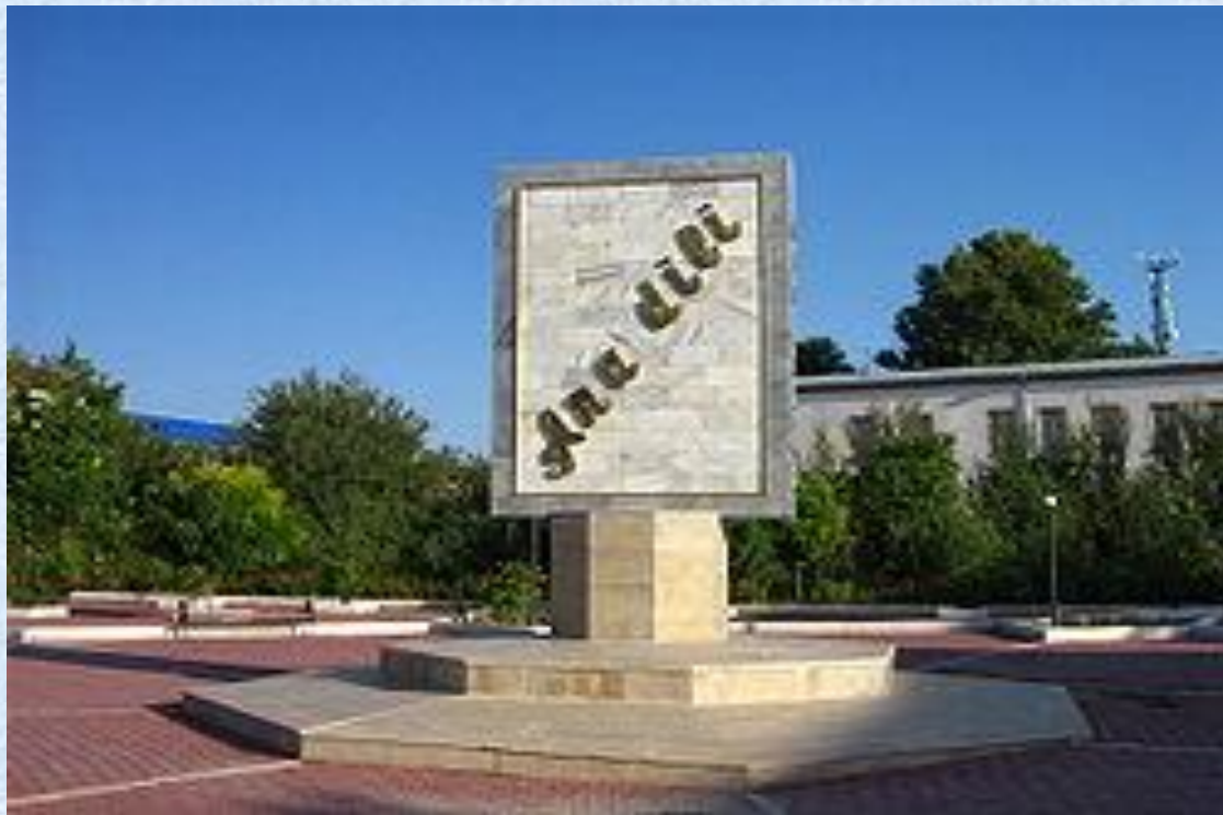
Памятник родному языку в г. Нахичевань

Азербайджанский язык является государственным языком Азербайджана. Указом президента Гейдара Алиева от 9 августа 2001 года был учреждён День азербайджанского алфавита и языка. Также азербайджанский язык является официальным в Дагестане . В мире на азербайджанском языке говорят 30 млн.