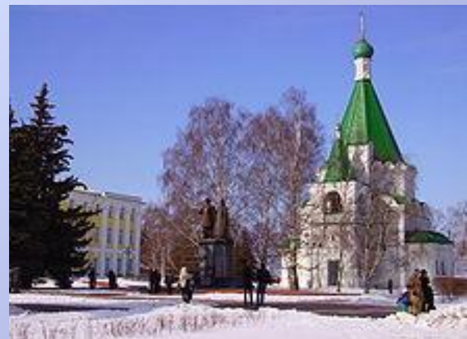
Памятник князю Юрию Всеволодовичу и епископу Симону Суздальскому у Архангельского собора в Кремле

Нижний Новгород — пятый по численности населения город России с населением 1 278 803 человек, важный экономический, транспортный и культурный центр страны. По национальному составу преобладают русские. В Нижнем Новгороде проживают также представители других национальностей — татары, украинцы, чувашаи, мордва, армяне, азербайджанцы, белорусы, грузины, евреи, марийцы, цыгане. Жители Нижнего Новгорода называются "нижегородцы".