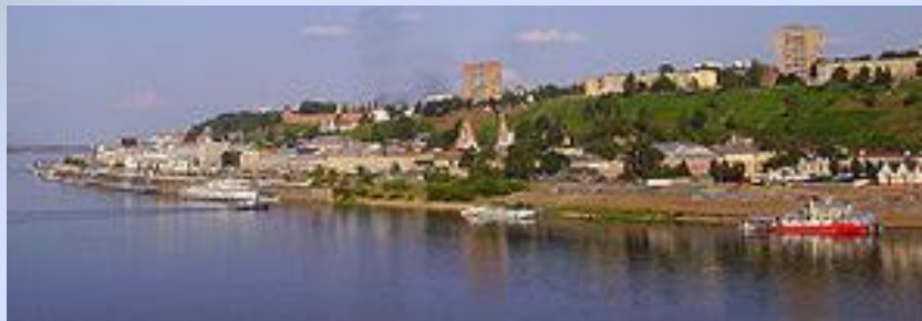
Вид на центр города с Канавинского моста