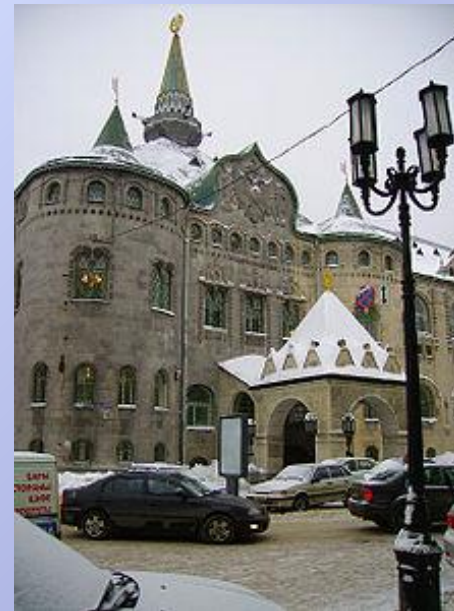
Государственный банк на Большой Покровской улице

В историческом центре города расположен каменный кремль начала XVI века — двухкилометровая кирпичная крепость с 13 сторожевыми башнями. На территории Кремля находится Михайло-Архангельский Собор, построенный в середине XVI века. Так же сохранились многочисленные памятники деревянного зодчества.