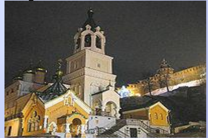
Церковь Рождества Иоанна Предтечи

Благовещенский монастырь был основан в XIII веке, вскоре после основания Нижего Новгорода.