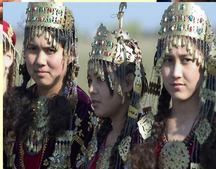
Туркмены, армяне и др. 7%