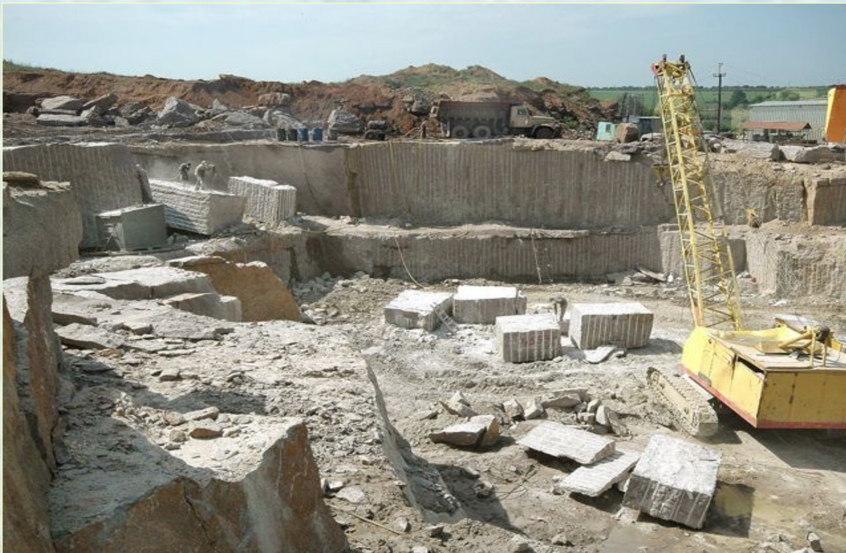
Добыча камня в карьере