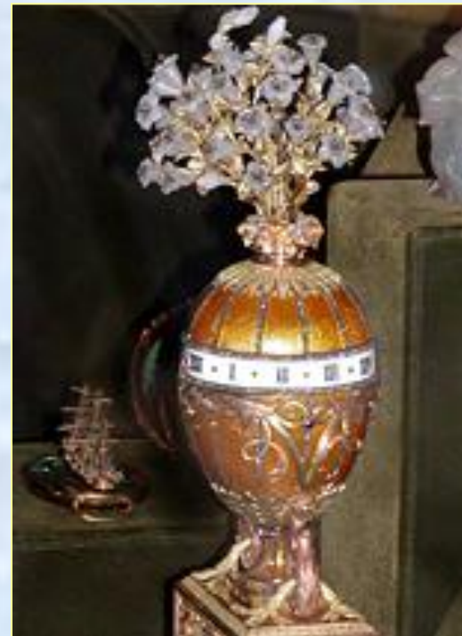
БОЛЬШОЙ БУКЕТ Бриллианты, изумруды, золото, серебро (1760 г.)