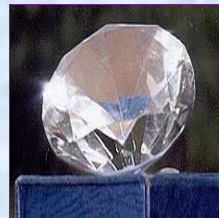
Добыча алмазов в Якутии