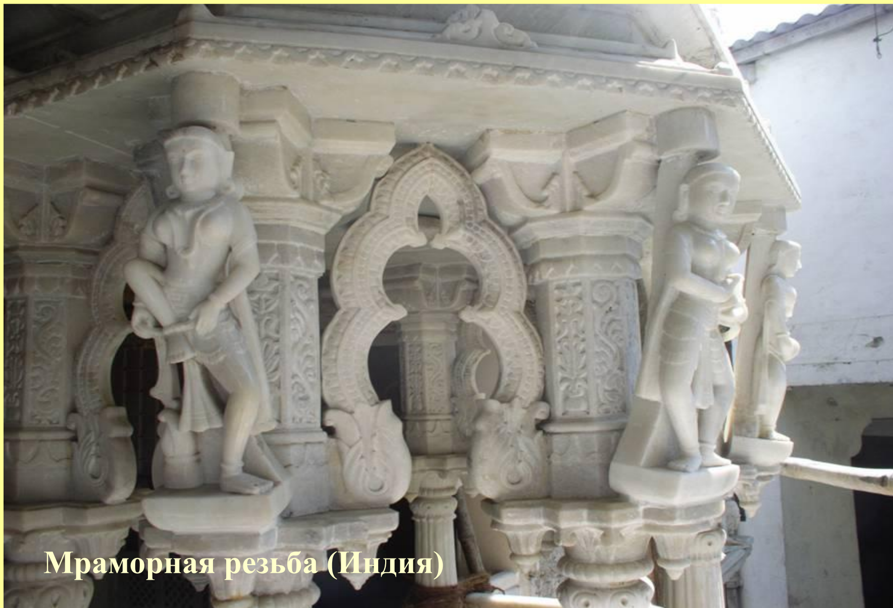
Мраморная резьба (Индия)