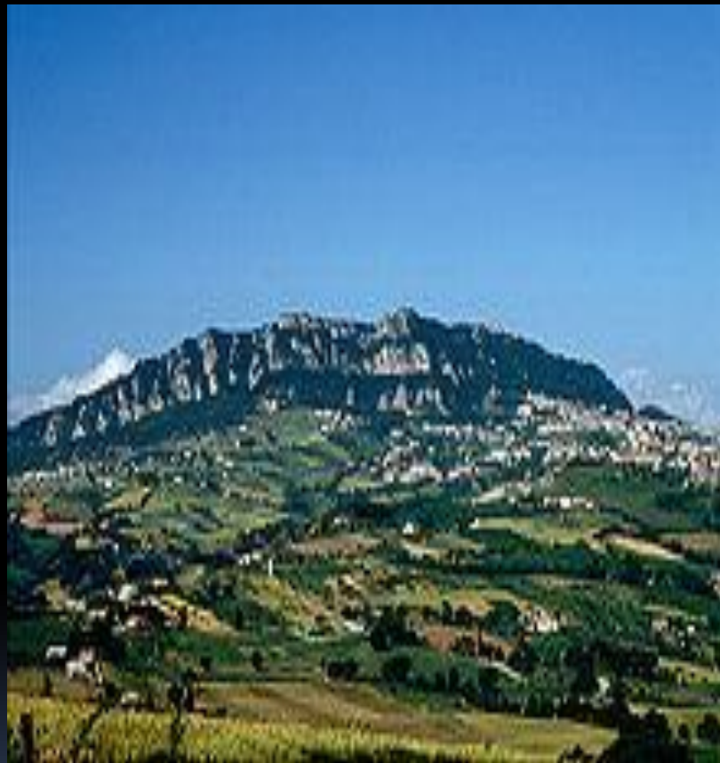
Гора Монте-Титано с её башнями — один из символов Сан-Марино

С 1985 года в Сан-Марино функционирует университет. С 1983 года в Сан-Марино открыта Международная академия наук Сан-Марино — международная научно-образовательная организация с штаб-квартирой в словацком городе Комарно. Рабочими языками академии являются немецкий, английский, французский, итальянский и эсперанто. Академия наук Сан-Марино присуждает международные учёные степени: бакалавра, магистра, доктора и доктора высшей степени.