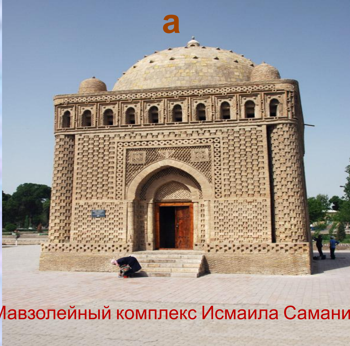
Мавзолейный комплекс Исмаила Самани