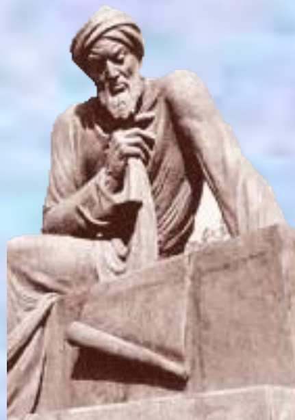
Аль – Хорезм