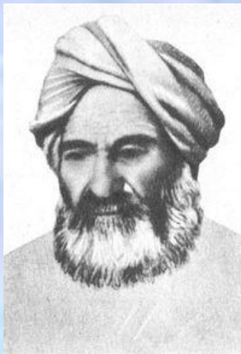
Абу Райхан Бируни,