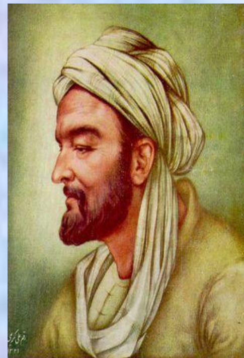
Абу Али ибн Сина.