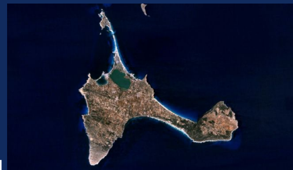
о. Форментера (фотография со спутника)

Форментера - один из Балеарских островов, расположенных в Средиземном море, принадлежит Испании. Длина острова — 23 километра, ширина — 2-17 км, он расположен примерно в 6 км к югу от Ибицы. Площадь — 82 кв.км., побережье - 69 км. Население 8 тыс. жителей. Вокруг острова расположена целая цепь небольших островков, среди которых с северной стороны находятся такие острова, как Illa de s'Espalmador (1,3 кв. км) и s'Espardell (0.5 кв. км.). Основные населенные пункты — Сан-Франциск-Хавьер, Сан-Ферран-де-сес-Рокес, Эль-Пилар-де-ла-Мола и Ла-Савина. На остров можно попасть только по морю с Ибицы, поэтому Форментера — самый тихий из Балеарских островов. Остров известен еще и тем, что на всех его пляжах нет запрета на нудизм. Считается, что название острова происходит от латинского слова frumentum , что означает «пшеница».