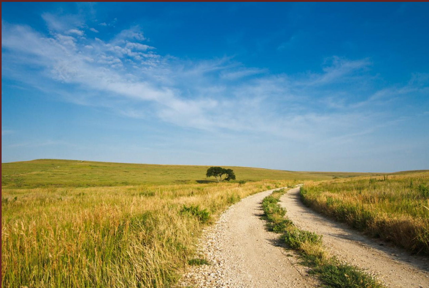
Центральные равнины в Канзасе