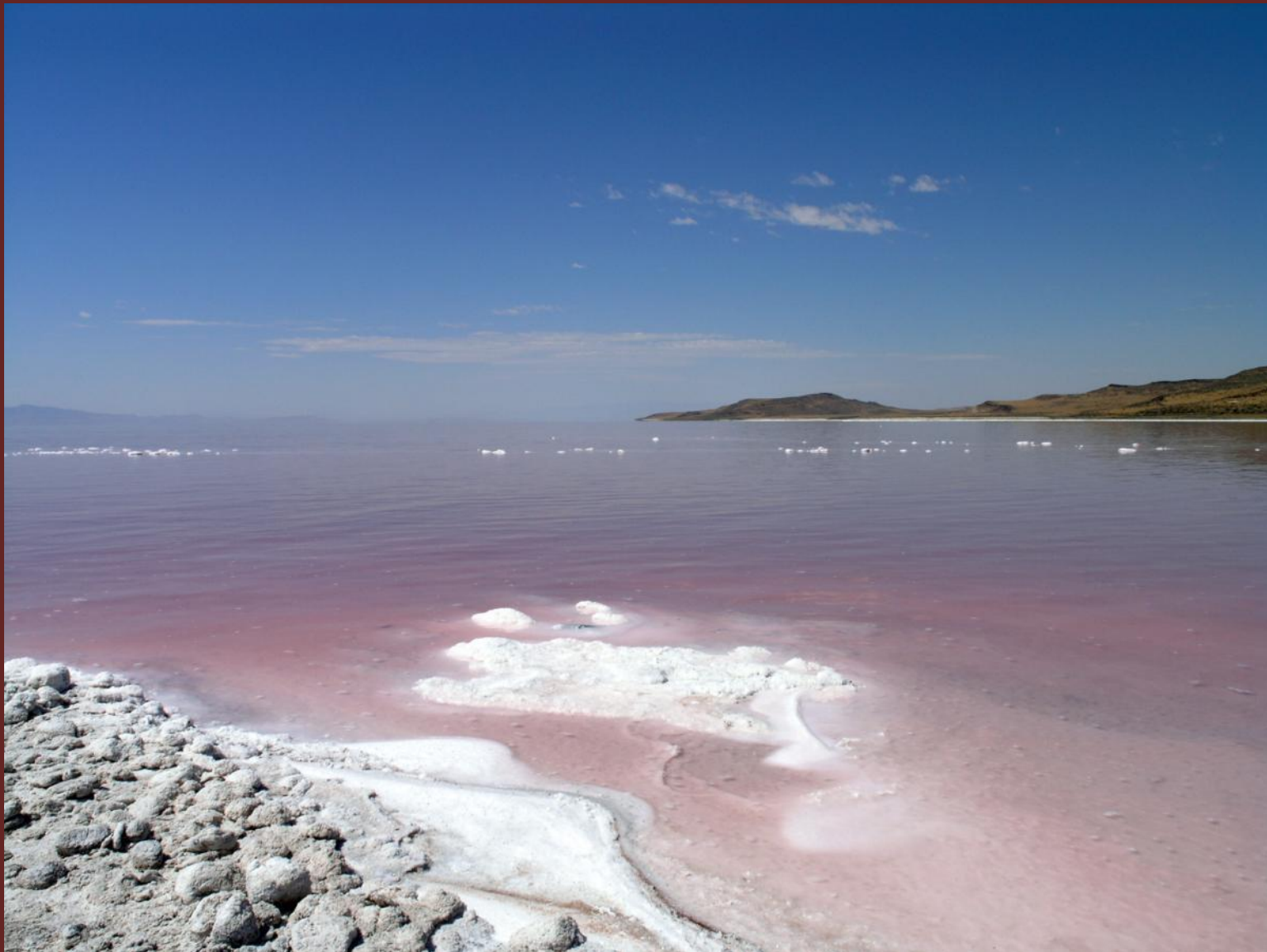
Большое Солёное озеро