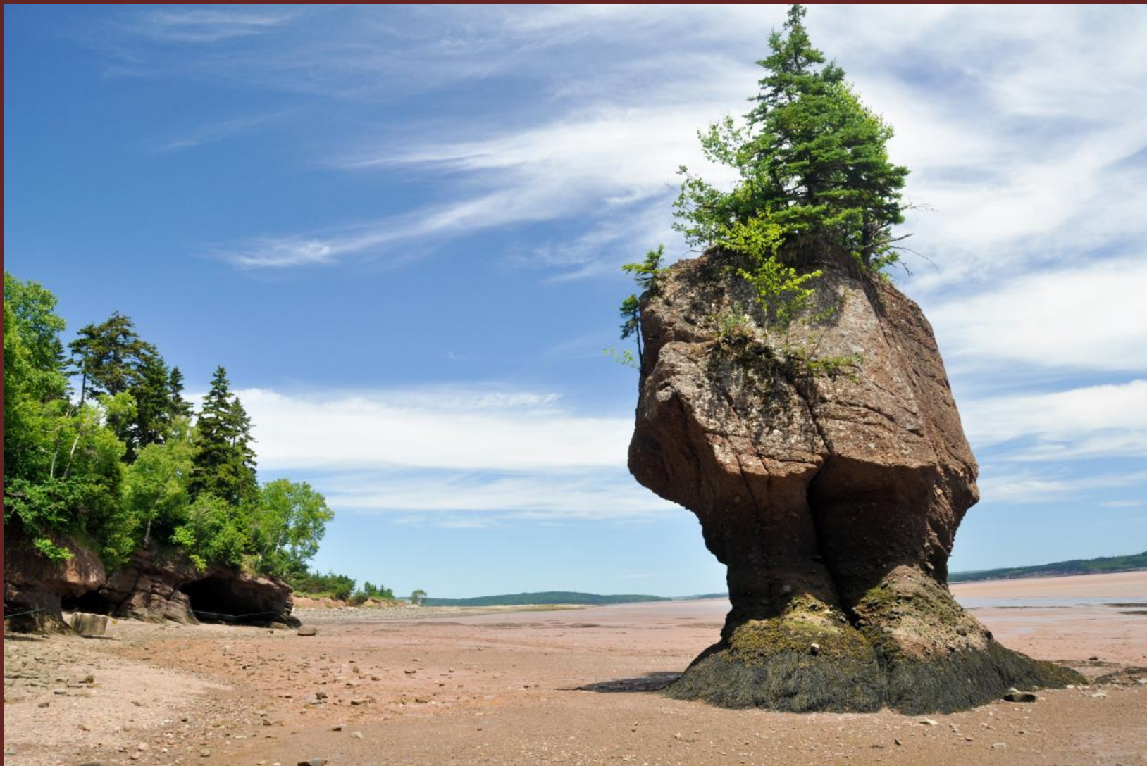
Отлив в заливе Фанди