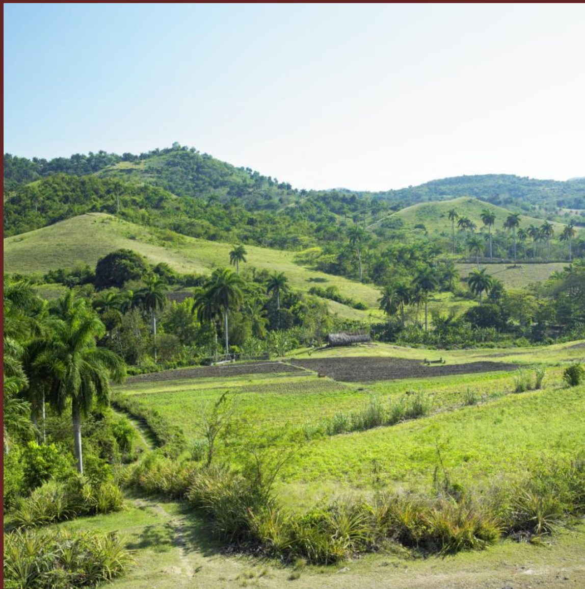
Ландшафт провинции Ольгин (Куба)