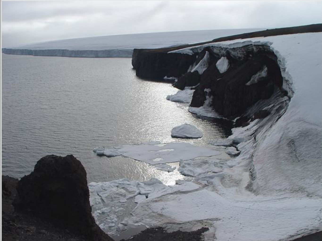
Арктика-2007. 26 рейс НЭО Академик Федоров. Земля Франца Иосифа. Остров Рудольфа. У мыса Флигели.