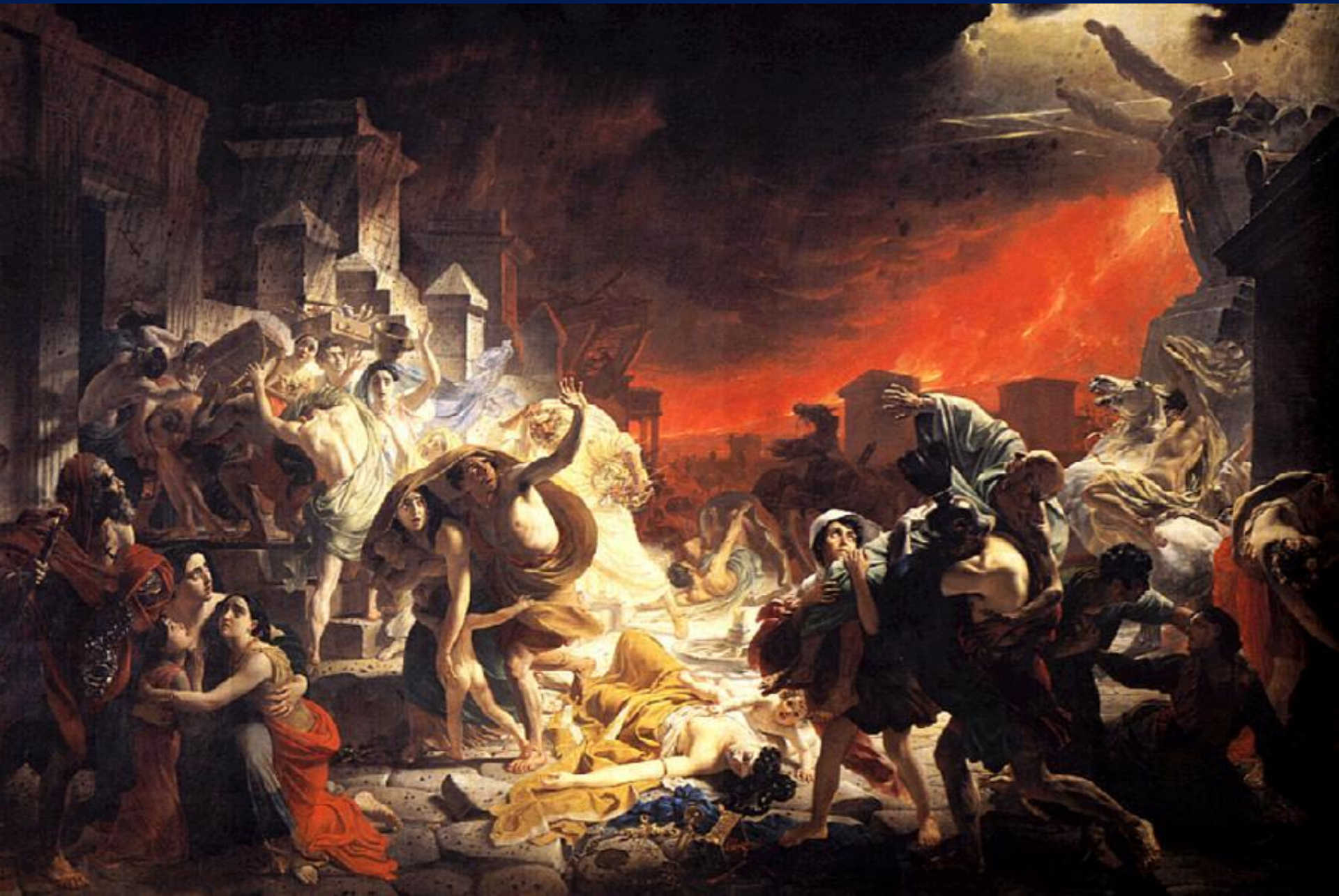
Брюллов. К.П. «Последний день Помпеи». Создание: 1828 года.