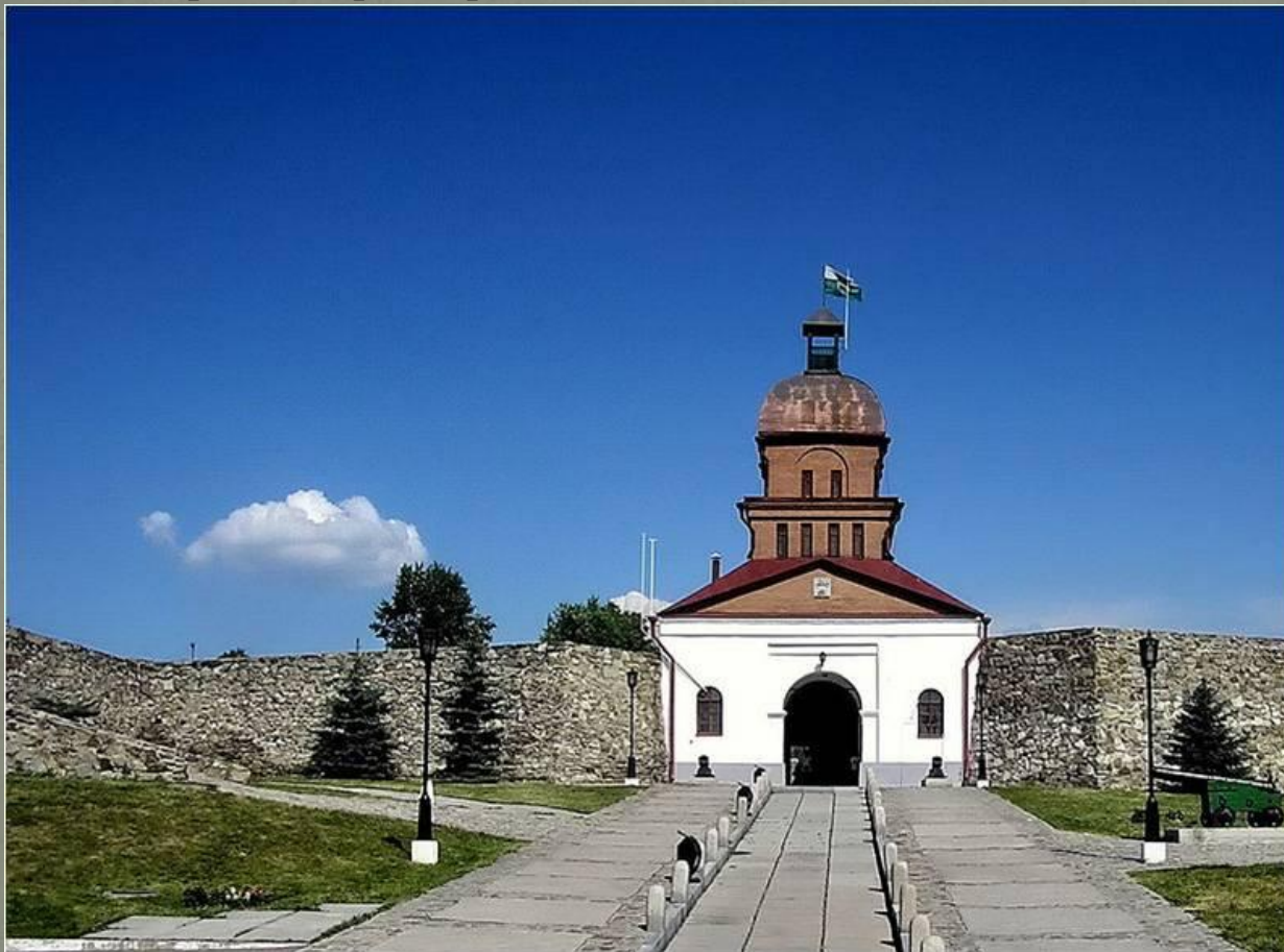
На фото- Кузнецкая крепость.

Новокузнецк - крупнейший город Кемеровской области областного подчинения (Новокузнецкий городской округ); административный центр Новокузнецкого района Кемеровской области России. Расположен на левом и правом берегах реки Томи.