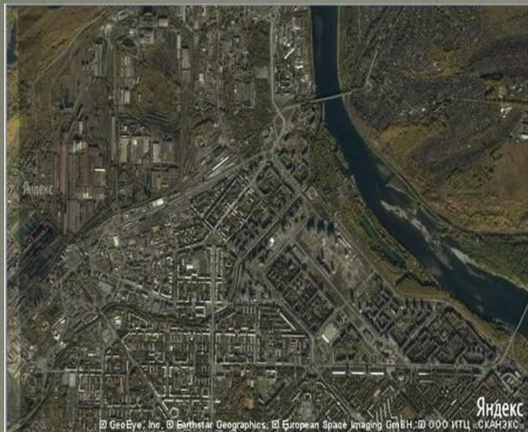
Так выглядит город со спутника