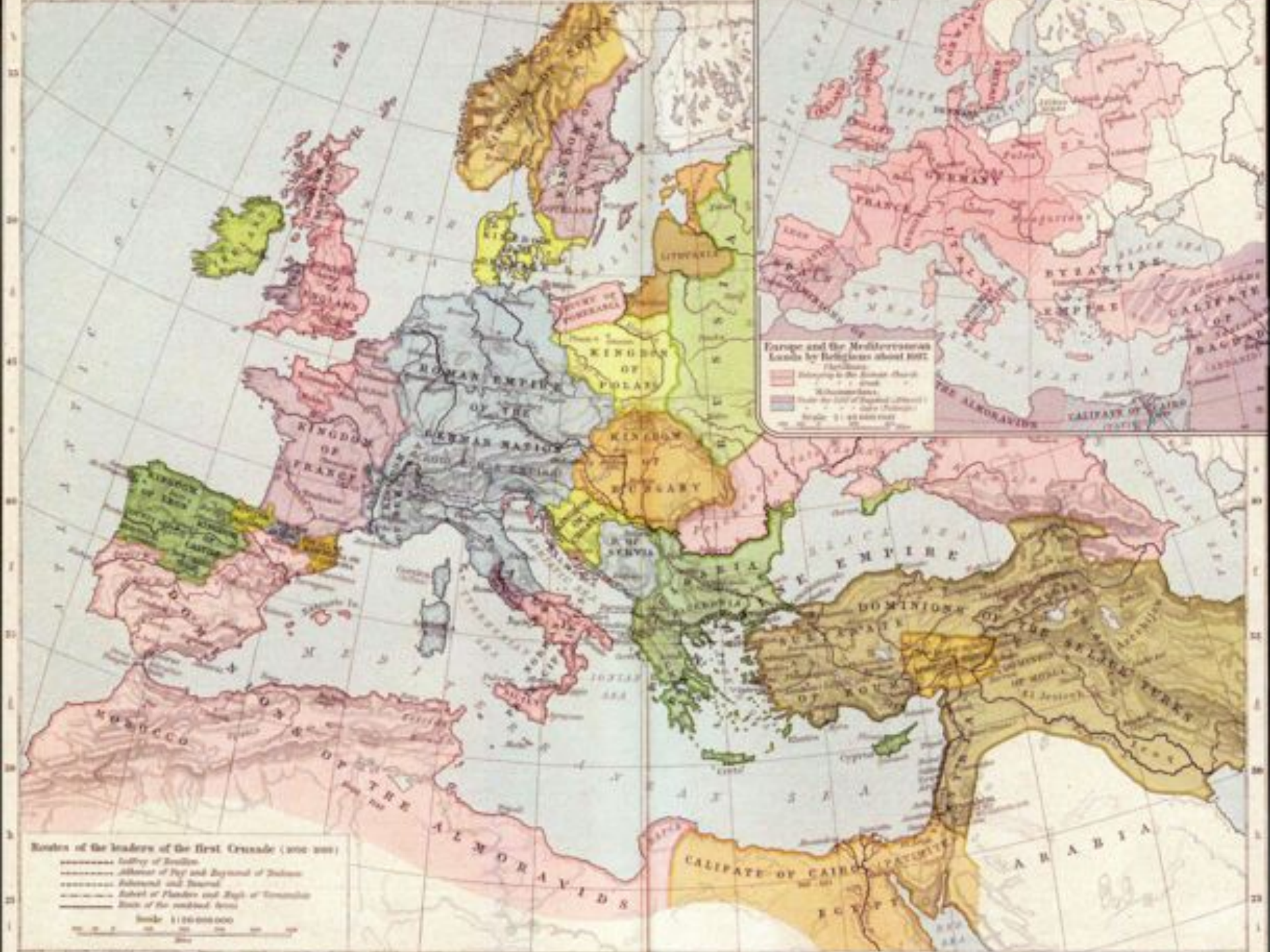
Europe and the Mediterranean Lands by Religion about 1097 (Approximate) ■ Subject to the Roman Church ■ Subject to the Eastern Church ■ Under the rule of Muslim (Arabs or other Moslems) Scale: 1:10,000,000