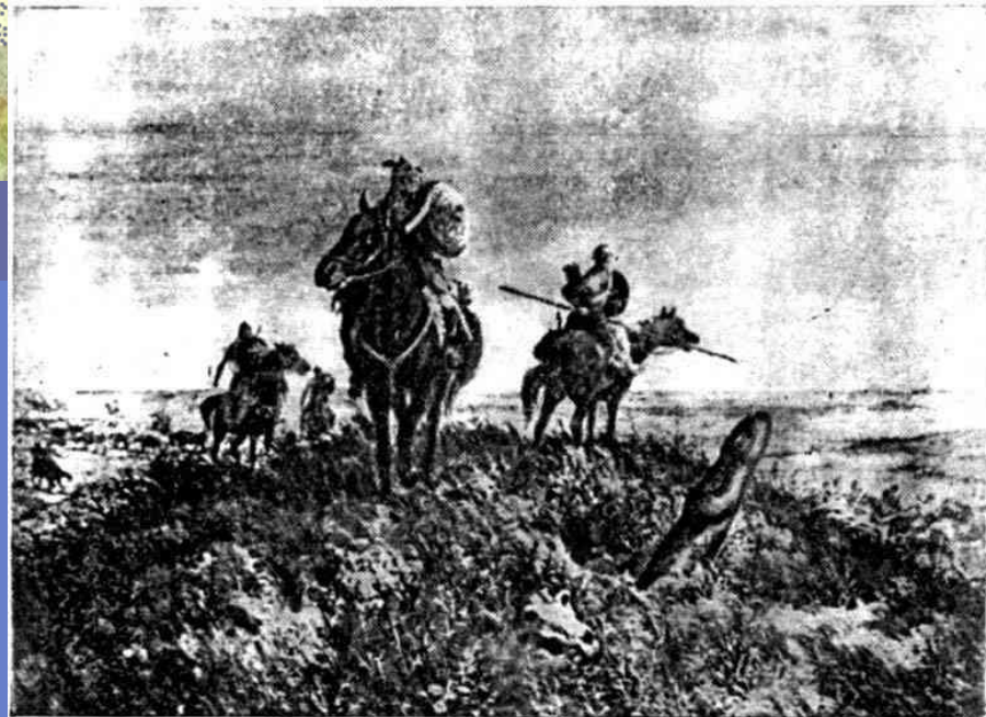
Набег кочевников (с карт. худ. Зубарева).

Горы защищали от набегов кочевников (прекратились к 1000 г.)