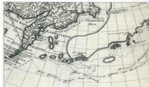
Карта открытий российских мореплавателей. Около 1770 г.