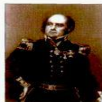
Дж. Франклин (1786–1847), английский полярный исследователь. Руководил полярными экспедициями, открывшими арктическую час побережья Северной Америки