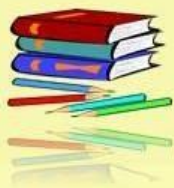
Саратовский государственный аграрный университет им. Н.И. Вавилова