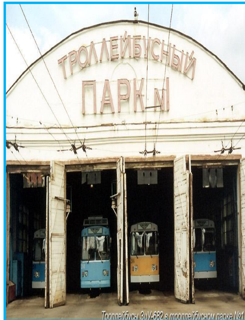
Троллейбусы ЗиУ-682 в троллейбусном парке №1