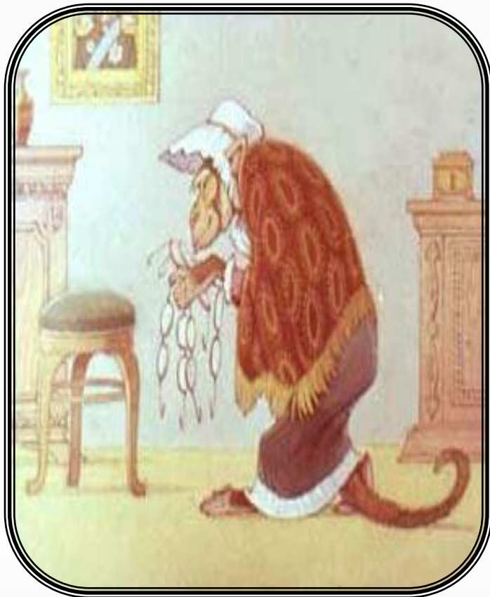
Мартышка и очки