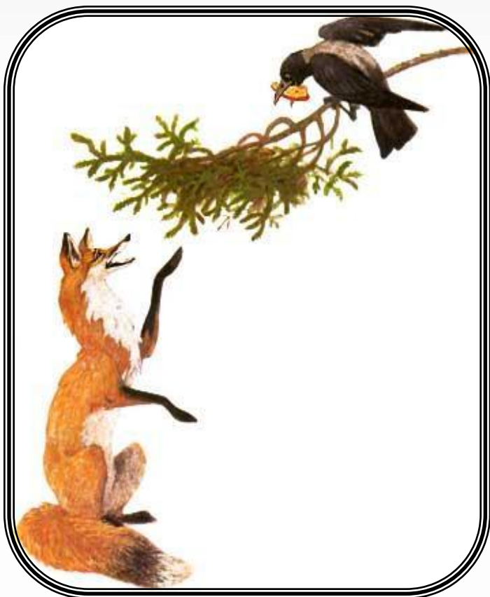
Ворона и Лиса