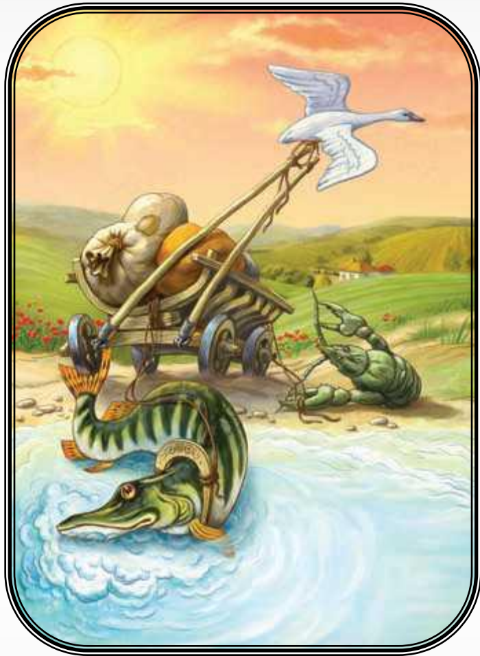
Лебедь, Щука и Рак