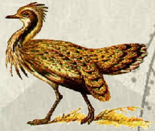
ДРО Ф А