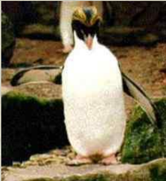
ПИНГ В ИН