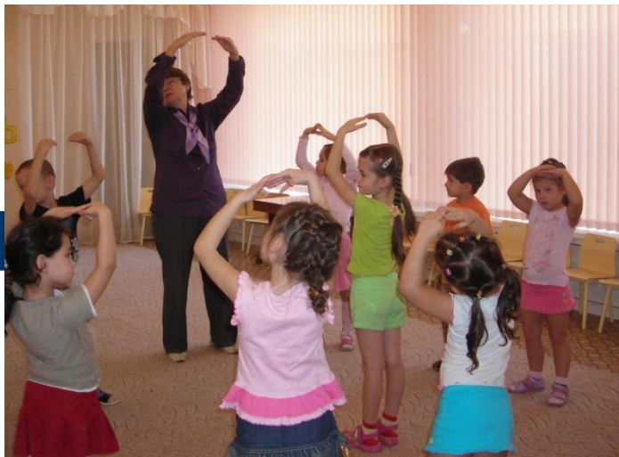
Разучиваем татарский народный танец