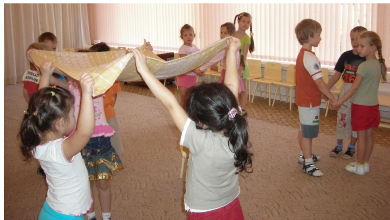
Играем в башкирскую игру «Юрта»