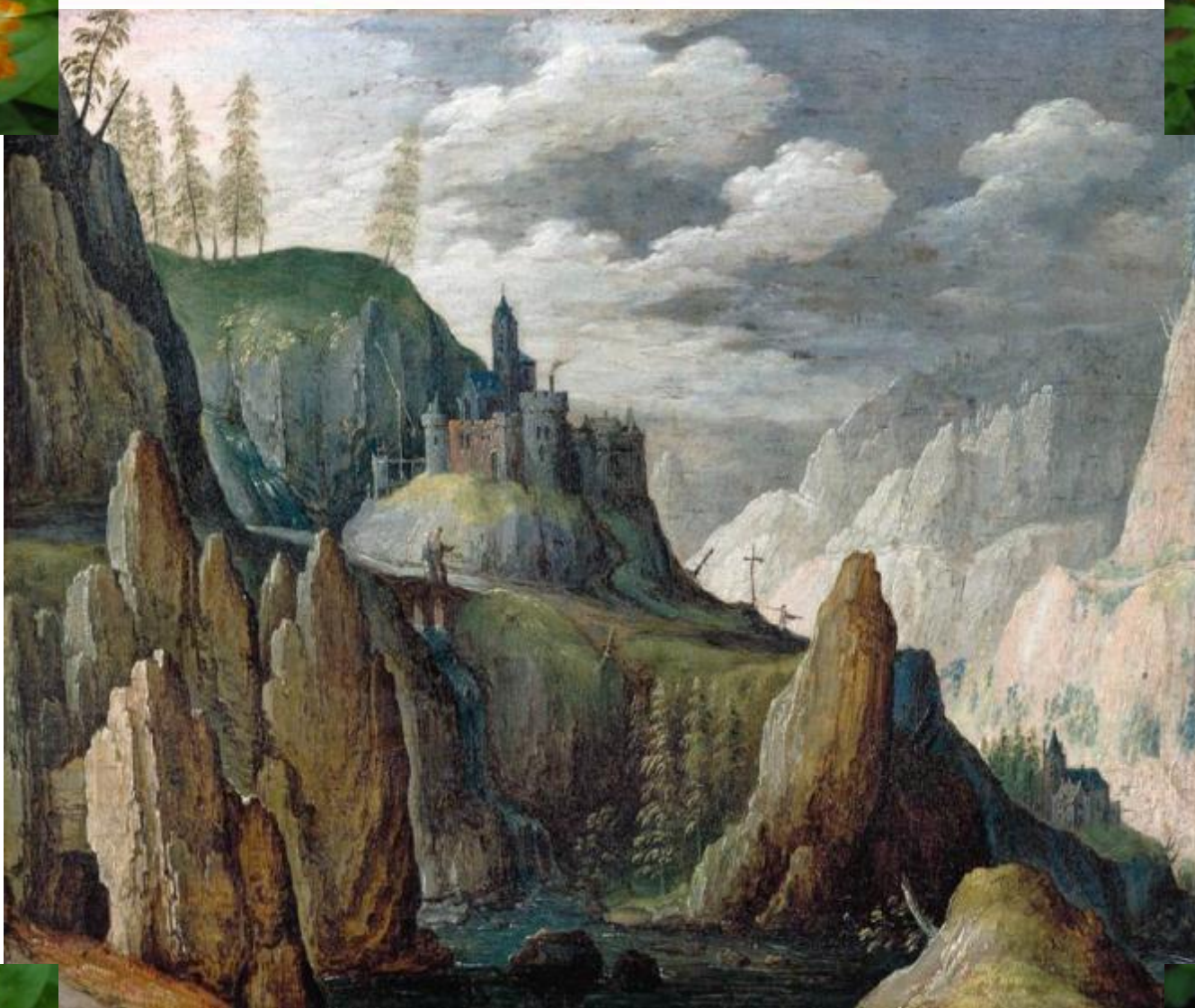
Томас Саркк Горный пейзаж