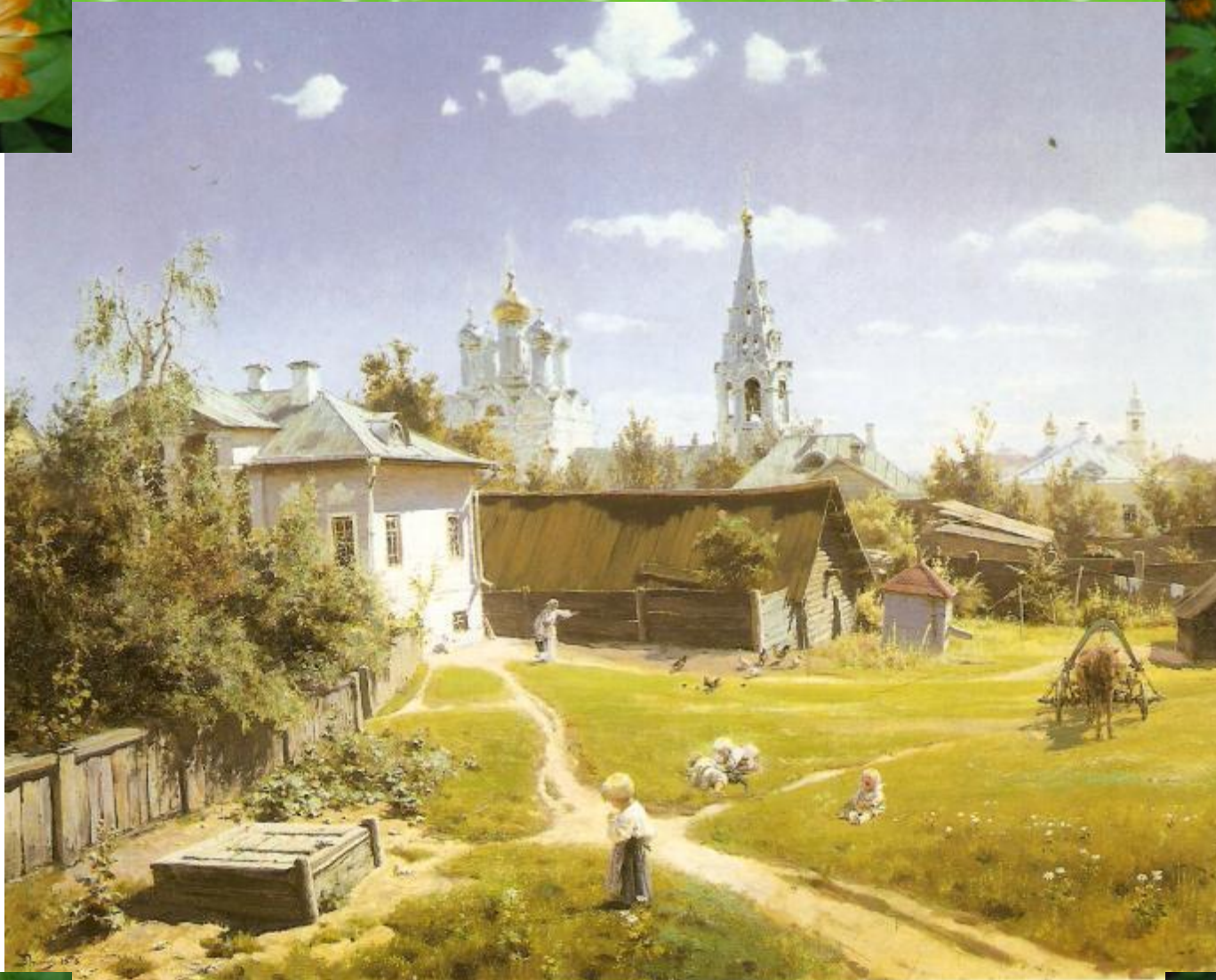
Поленов В.Д. Московский дворик. 1878