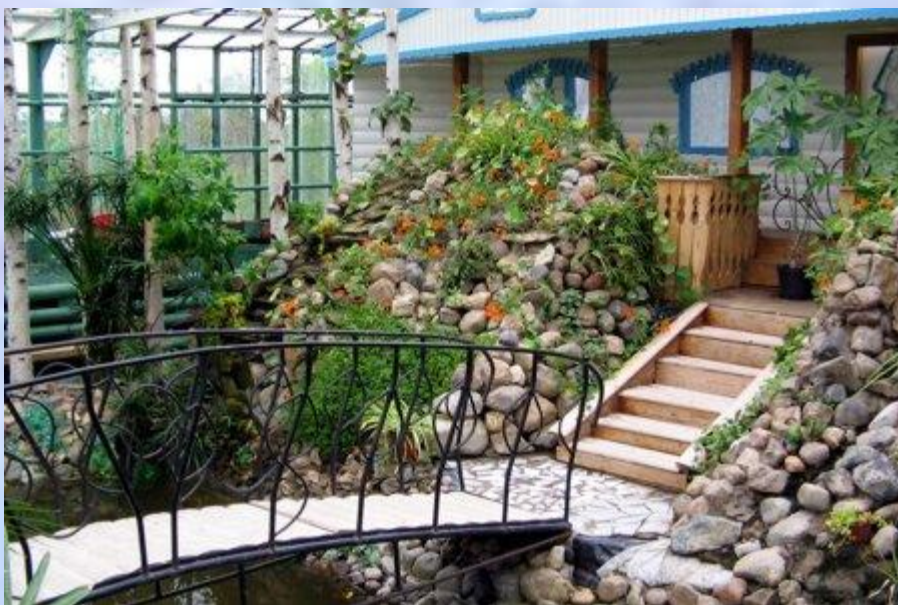
зимний сад Деда Мороза.