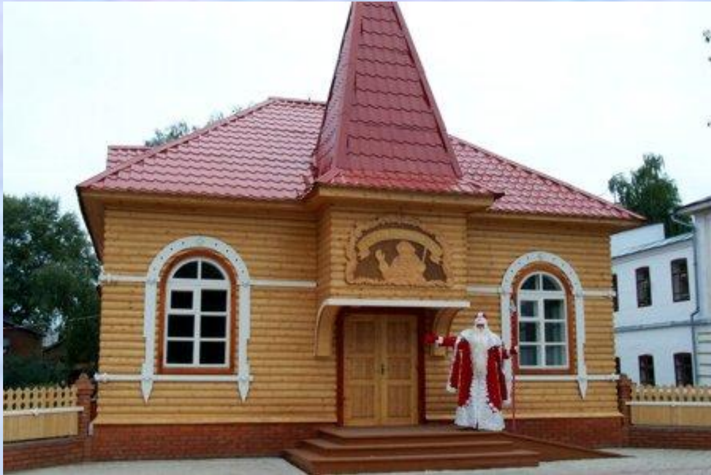
Почта Деда Мороза

Почта Деда Мороза находится в центре города Великий Устюг в красивом деревянном тереме.