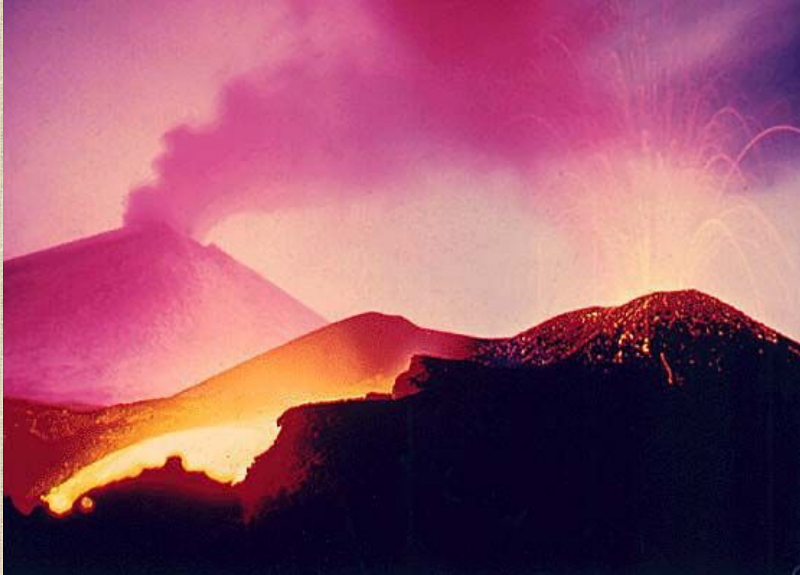
Трещинное извержение вулкана Толбачек на Камчатке