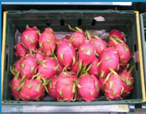
питайя- дракон фрукт