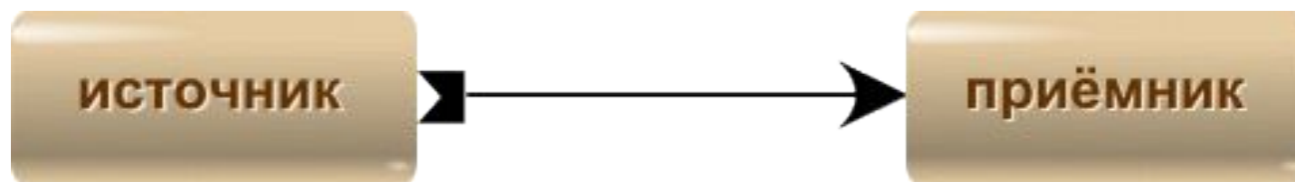
схема передачи информации

В передаче информации всегда участвуют две стороны: тот, кто передаёт информацию — источник (передатчик) , и тот, кто её получает — приёмник .