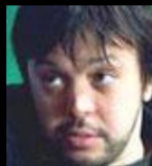
Швыдкой Сергей Михайлович