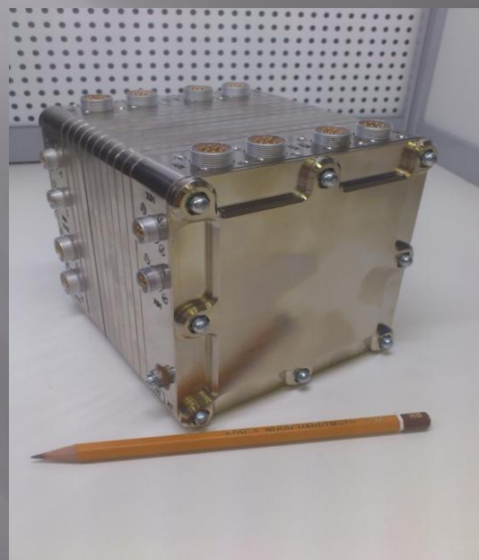
ЦВМ22- прототип (КА «Глонасс- К»)