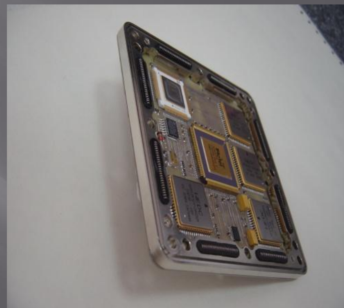
ЦВМ28-первый этап проекта