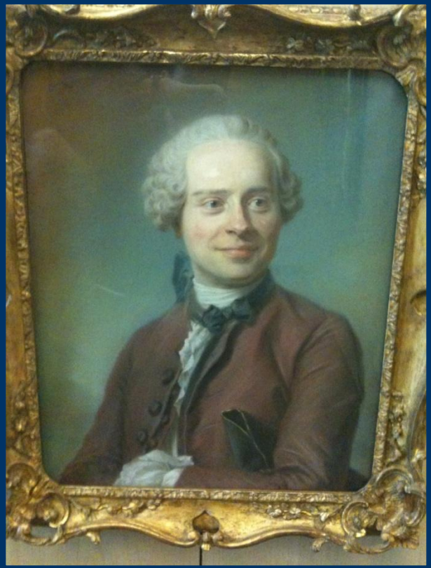
Жан Лерон Д'Аламбер (1717-1783)