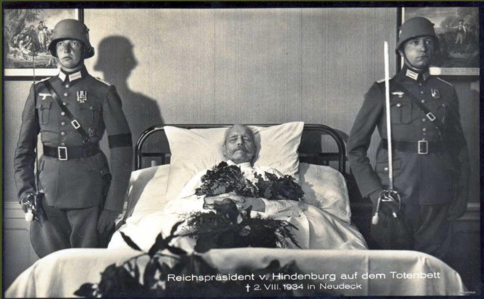
Reichspräsident v. Hindenburg auf dem Totenbett † 2. VIII. 1934 in Neudeck

Пауль фон Гинденбург умер 2 августа 1934 года в своем родовом поместье Нойдеке.