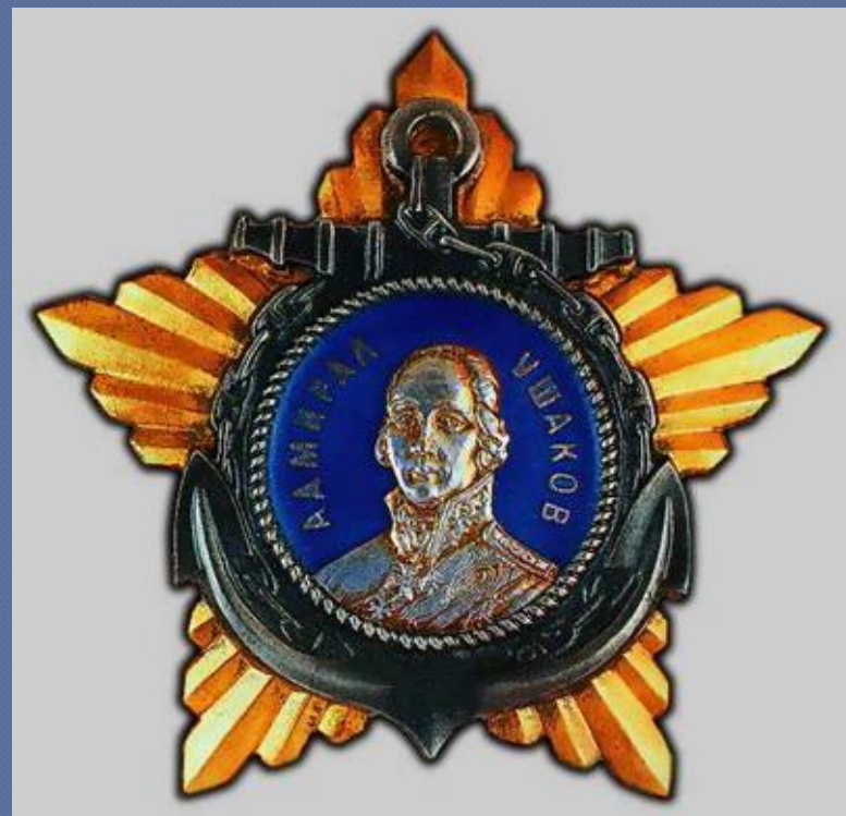
Орден Ушакова II степени