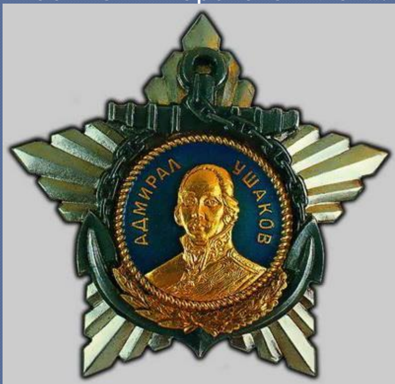
Орден Ушакова I степени

Советская флотская награда времён Великой Отечественной войны. Учреждён Указом Президиума ВС СССР от 3.03.1944 об учреждении военных орденов: ордена Ушакова I и II степени и ордена Нахимова I и II степени, одновременно с орденом Нахимова специально для награждения офицеров Военно - Морского Флота.